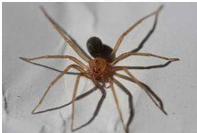
Figura 2. Araña Marrón, Loxosceles laeta

Al día 5 siguiente la gestante regresa a consulta refiriendo que su hermana menor comenzó a presentar un cuadro similar por lo que se decidió visitar el domicilio con los agentes de endemia del municipio encontrándose una colonia de araña marrón (Figura 2) en el interior del baño de la casa, también se encontró la existencia de exoesqueletos, dejados por la muda de la araña detrás de un cuadro.