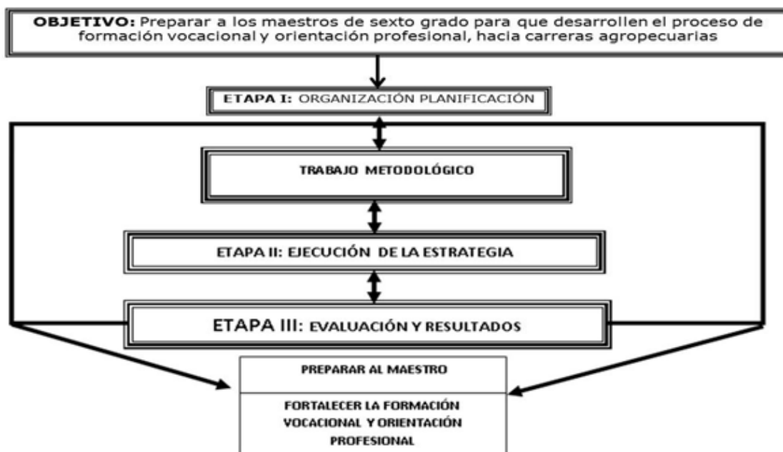
Fig. 1. Esquema que muestra las etapas de la estrategia pedagógica diseñada

La estrategia pedagógica propuesta está conformada por dos acciones estratégicas para el proceso de preparación de los maestros de sexto grado dirigidas al fortalecimiento de la FV y OP hacia carreras agropecuarias.