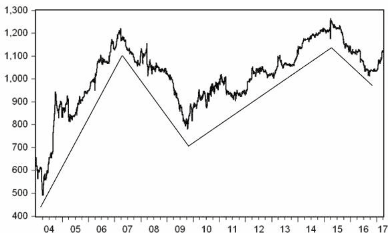
Figura 1. Cotizaciones diarias Ecuindex.

Con la finalidad de poder describir el primer objetivo específico es necesario en primer lugar explicar sobre la muestra. Los datos son tomados con cadencia diaria a partir del 5 de enero de 2004 hasta el 31 de marzo de 2017 en donde los precios del índice Ecuindex fueron proporcionados por la bolsa de valores de Quito, véase a tal propósito la figura 1.