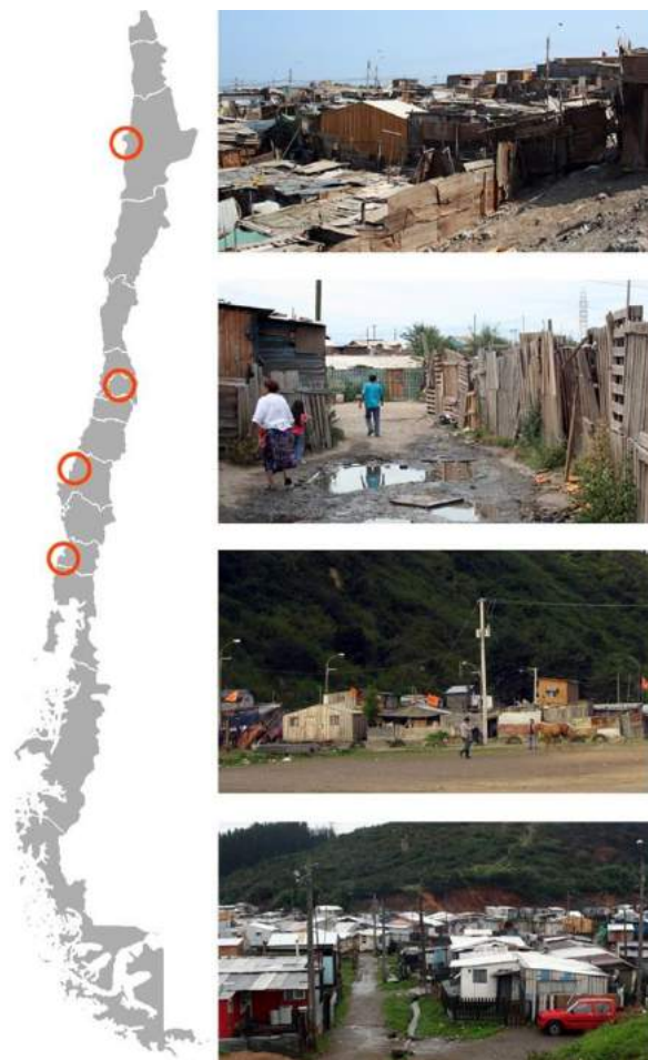
Figura 1. Campamentos en Chile

Más allá de la ausencia de propiedad y del acceso limitado a servicios urbanos, los campamentos (Figura 1) generalmente están localizados en sectores de baja calidad medioambiental, construidos con materiales y métodos de calidad cuestionable, sin cumplir regulaciones urbanas y constructivas (Wekesa, et al., 2011). Además, la informalidad urbana involucra un creciente número de desempleados, empleos esporádicos y de subsistencia en la calle (Al-Sayyed, 2004). Estas características más el hacinamiento y la falta de educación, evidencian la vulnerabilidad de las familias que viven en campamentos en Chile, mismos que se caracterizan por condiciones no sustentables.