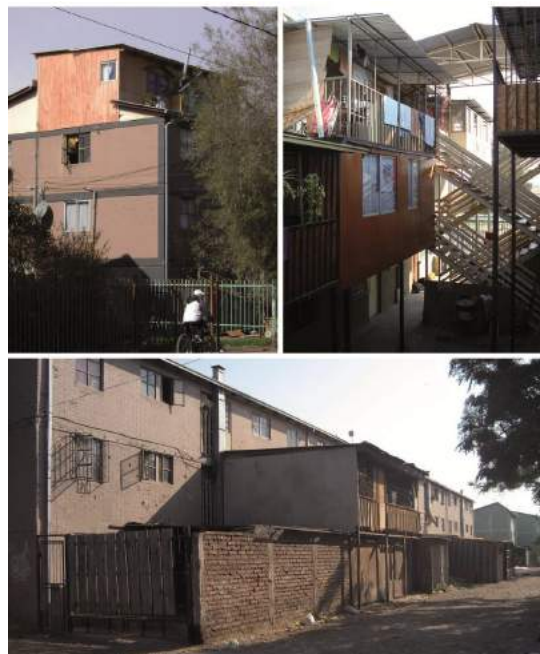
Figura 3. Proyectos de vivienda social desarrollados en la región metropolitana entre 1995 y 2000.

Imágenes de José Ignacio Selles ilustrando las limitaciones para ampliar las viviendas y el pobre diseño de los espacios públicos y colectivos en San Bernardo, Puente Alto y El Bosque.