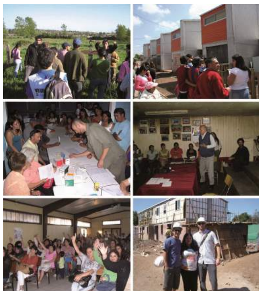
Figura 6. Habilitación Social desarrollada por TECHO.

A pesar que en Chile es posible encontrar interesantes ejemplos donde residentes de campamento son actores relevantes en sus procesos de vivienda ( Figura 6. ) es contra productor para una política remediar una excepción a través de excepciones. Si la necesidad es concebida como un asunto de Estado, ésta no puede ser regulada por normas previamente establecidas (Agamben, 2005). Su persistencia implica repensar leyes y políticas para remediar la excepción.