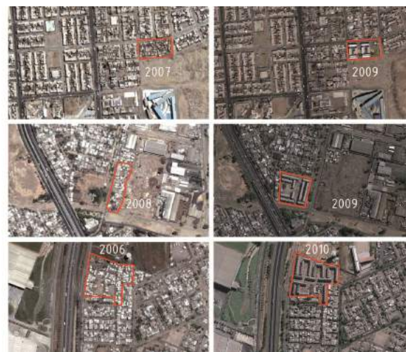
Figura 5. Proyectos de vivienda social de SDL desarrollados por TECHO entre 2005 y 2010.

Vivienda social desarrollada por TECHO que, incluyendo SDL, prioriza la escala pequeña y la localización para preservar las redes existentes en Antofagasta, Renca y Lo Espejo. Elaboración del autor (José Lorenzo di Girolamo Arteaga).