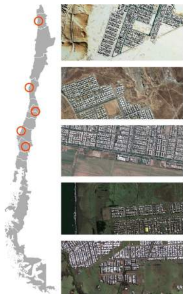
Figura 4. Vivienda Social desarrollada entre 1980 y 2005.