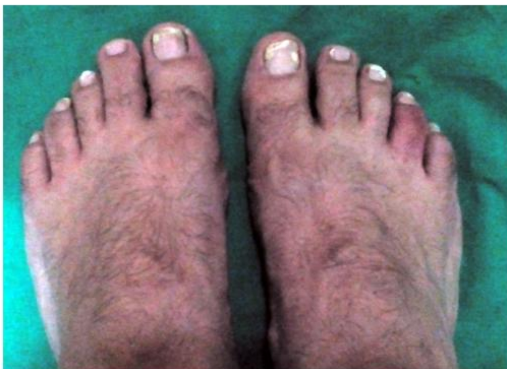
Figura 1. Lesiones queratósicas en varias uñas de los pie, signos flogísticos en el segundo dedo del pie derecho (dedo en salchicha).

Paciente masculino, de 42 años de edad, que es remitido a la consulta de reumatología desde el servicio de dermatología donde había consultado por presentar las uñas de los pie con lesiones queratósicas y dolor con elementos inflamatorios en el 2do dedo del pie derecho. [Figura 1]