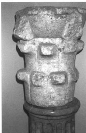
Fig. 6.- Sevilla. Museo de Bellas Artes. Capitel, siglo XII.