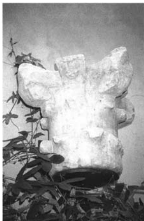
Fig. 3.- Sevilla. Palacio de Altamira. Museo. Capitel, siglo XII.