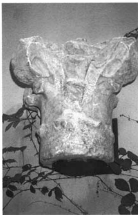
Fig. 5.- Sevilla. Palacio de Altamira. Museo. Capitel, siglo XII.