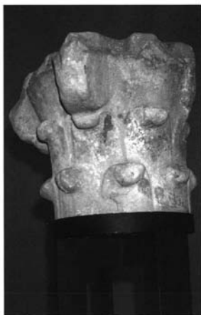
Fig. 8.- Sevilla. Colección particular. Capitel, siglo XII.