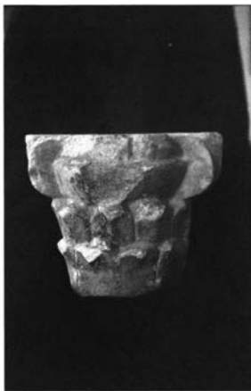
Fig. 7.- Colección particular. Capitel, siglo XII.