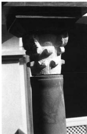
Fig. 1.- Sevilla. Palacio de Altamira. Patio Chico. Capitel, siglo XII.