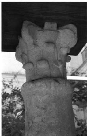
Fig. 2.- Sevilla. Palacio de Altamira. Patio grande. Capitel, siglo XII.