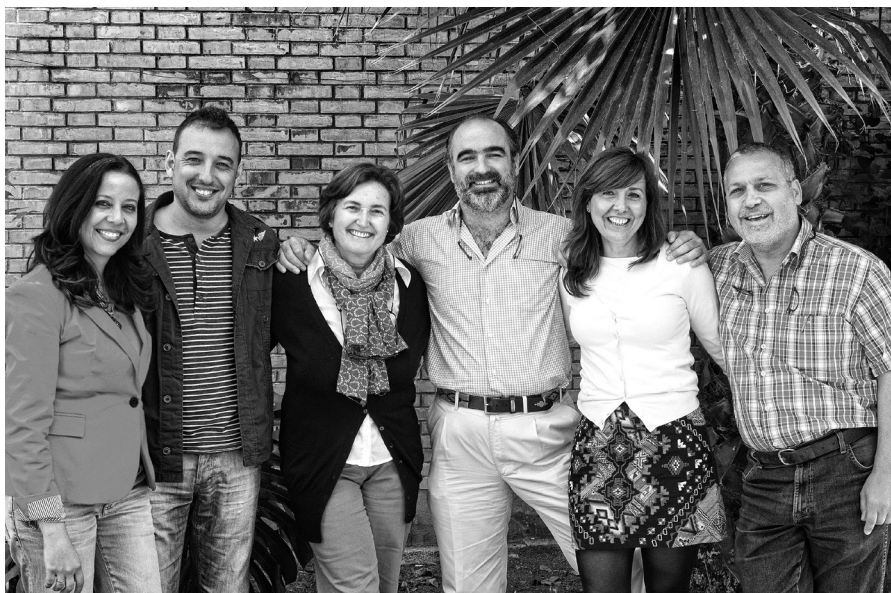
Equipo Directivo del Colegio de Santa Joaquina de Sevilla.

trasladó a una nueva casa contruida junto al colegio, dejando libres muchas zonas del edificio del centro que poco a poco se han ido adaptando para un uso académico. También se habilitaron aulas en la planta alta de bachillerato, y de dos ascensores que han facilitado mucha vida y el uso de todas las plantas de la escuela. Se hicieron mejoras importantes en ampliación y rehabilitación de pasillos, patios de recreo, vallado del centro, separación de los recreos de infantil y primaria, mejoras en aseos y vestuarios en los patios, mejoras en las terrazas y tejados, aparcamientos, rehabilitación de la cocina, zonas para el profesorado, especialización de aulas, rehabilitación de laboratorios, arreglo y actualización de sistemas eléctricos, etc. Valió la pena y el centro seguía cada año actualizándose y mejorando.