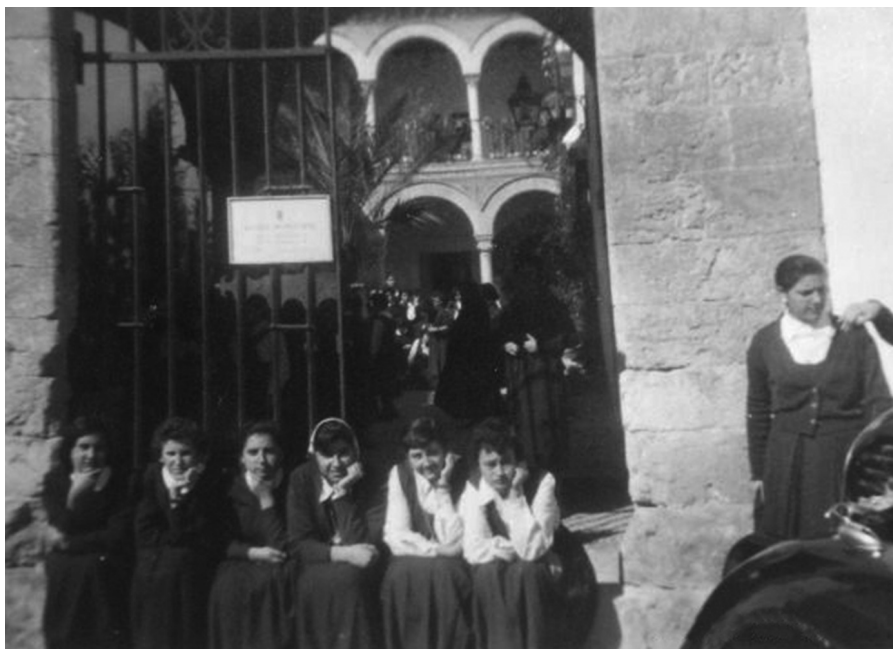
Alumnas del Colegio de San Joaquín de Sevilla.

olvidar que los objetivos fundacionales eran atender a la educación de niñas pobres y la escuela de pago había surgido para ayudar a su sostenimiento. Aunque el colegio era exclusivamente de niñas, también se admitían niños hasta los siete años, que iban a clases diferentes a las niñas. A partir de 1963 se unieron las niñas gratuitas con las de pago. Los tiempos cambian y el buen hacer de las hermanas había promovido que muchas familias confiaran en ellas para la educación de sus hijas. Sin alejarse un ápice de sus fines, la unificación de las niñas de pago con las gratuitas significaba la normalización y la integración de todas las niñas en una educación común, resaltando el valor humano y cristiano de la inclusión que las hermanas han subrayado y potenciado siempre.