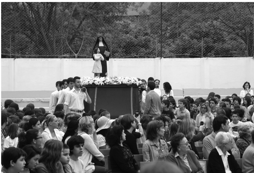
Procesión de Santa Joaquina de Vedral.

En los tiempos fuertes del año litúrgico, adviento y cuaresma, se trabaja y se profundiza con diferentes actividades como celebraciones de la palabra y reflexiones diarias. Cada día, al comenzar la jornada, en todas las aulas se tiene una oración de comienzo, aplicándola al momento que se esté viviendo.