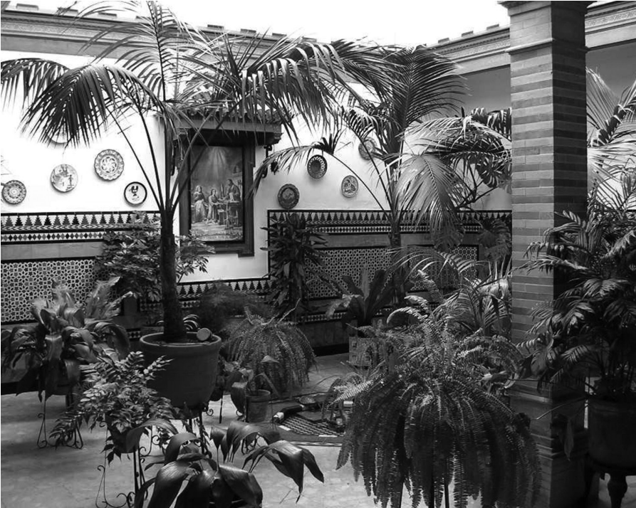
Patio del Colegio de la Sagrada Familia de Sevilla.

Para contrarrestar la influencia de las escuelas protestantes, muy prósperas en estos momentos, el padre Esclapés creó dos colegios –uno para niños y otro para niñas– con dos casas alquiladas en la calle Feria. En estos colegios recibían educación 300 niños y 300 niñas. Los gastos ascendían a 2.000 reales mensuales. Ante las dificultades económicas, el jesuita entrega los colegios a un grupo de mujeres católicas dirigidas por Marcelo Spínola, ecónomo de San Lorenzo y futuro cardenal arzobispo de Sevilla. Los dos colegios fueron trasladados en 1878 a la calle Torrejón.