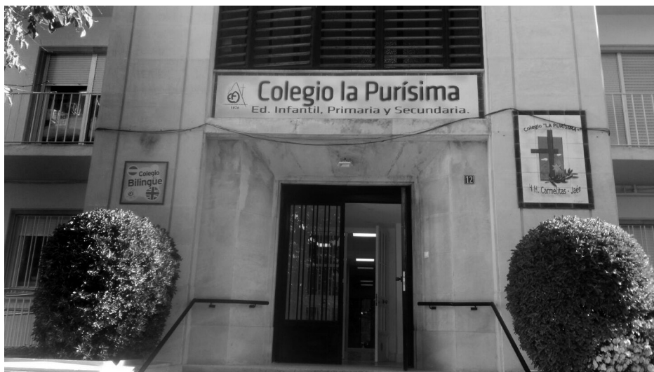
Colegio de la Purísima de Jaén.