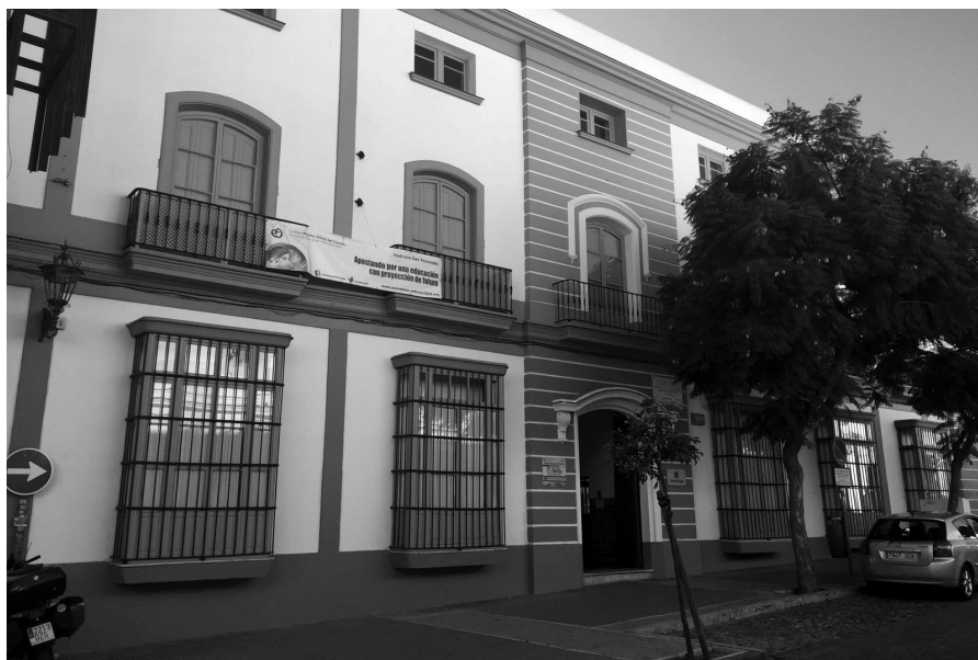
Fachada del Colegio Nuestra Señora del Carmen de San Fernando.

Un grupo de señoras de las Conferencias de San Vicente de Paúl, deseando fundar un asilo para niñas huérfanas, acuden a las hermanas del hospital de Cádiz, solicitando religiosas para dicho asilo. El 7 de octubre de 1863 un grupo