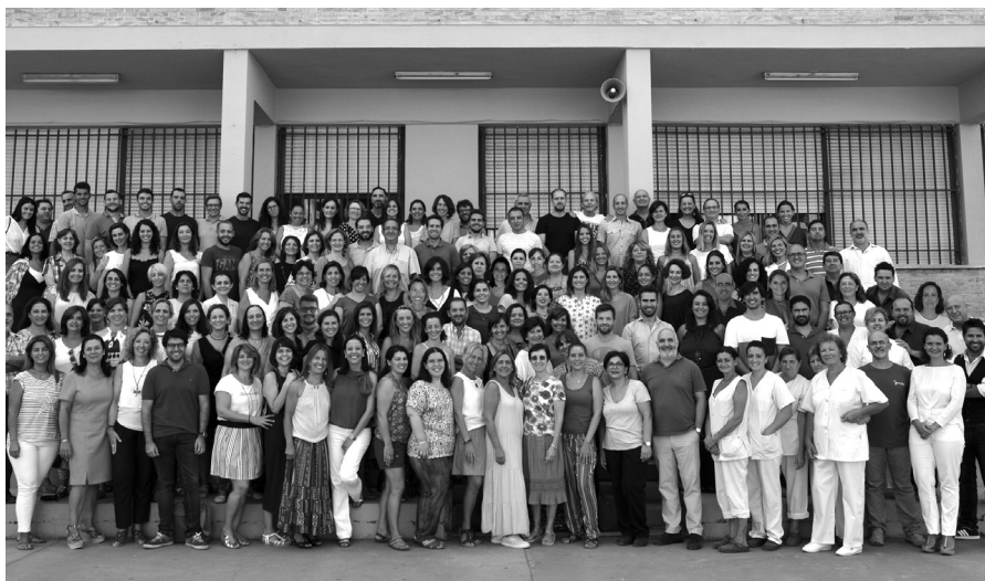
Claustro de Profesores del Colegio de Santa Joaquina de Sevilla.

profesional conectada con el mundo laboral a través de las Jornadas Interdisciplinarias y emprendimiento que llevan celebrándose anualmente desde que la nueva dirección iniciara su andadura.