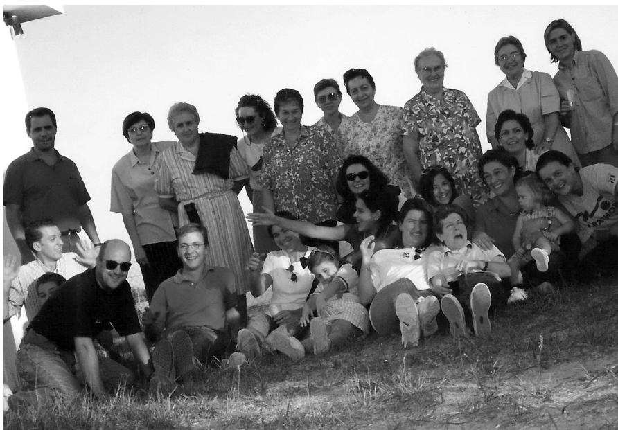
Profesores del Colegio de Santa Joaquina de Sevilla.

En esta búsqueda de soluciones de futuro se le propuso en 1994 a la Fundación de Educación Católica, FERE, que asumiera la gestión y titularidad del colegio, manteniendo el carisma Vedrúna, pero la FERE declinó hacerse cargo del centro.