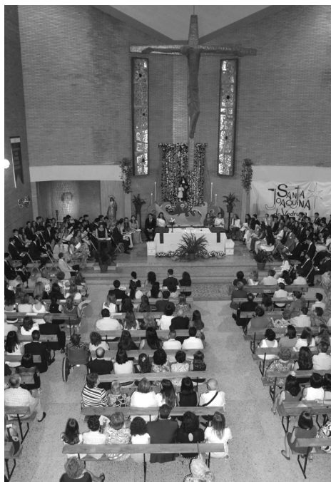
Capilla-Colegio de Santa Joaquina de Sevilla.

El 8 de enero de 1972 fue bendecida la iglesia por el cardenal Bueno Monreal, concelebrando los párrocos del Divino Redentor, San Bernardo y Santa Cruz de Sevilla. Asistieron antiguas alumnas y profesores, las hermanas de la comunidad de Pozo y las de La Palma del Condado y algunas religiosas. Después de la concelebración, el cardenal bendijo la casa 99 .