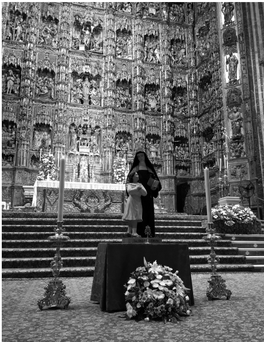
Catedral de Sevilla. Celebración del 50 aniversario del Colegio de Santa Joaquina en Nervión.

En el curso 2016-17 hay que destacar muy especialmente el proyecto Escuela de Fútbol de la Asociación Rutas del Polígono Norte de Sevilla. Esta asociación, surgida en el seno de la congregación, trabaja valores en los jóvenes de primaria y secundaria a través del deporte. Esta actividad conmemora el cincuenta aniversario del colegio de Santa Joaquina en el barrio de Nervión.