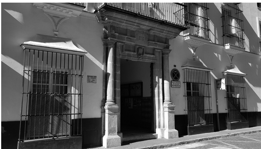
Colegio del Sagrado Corazón de El Puerto de Santa María.