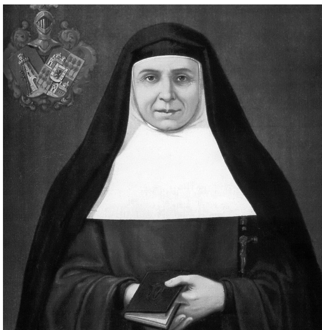
Santa Joaquina de Vedruna.

aprobación pontificia en 1877. Se instalan en la diócesis de Sevilla en la localidad de Castilleja de la Cuesta en 1889, procedentes de la comunidad de El Puerto de Santa María. En 1907 fundan en la ciudad de Sevilla el colegio de la Inmaculada Virgen María más tarde uno en una barriada popular de Sevilla: Nuestra Señora de Loreto.