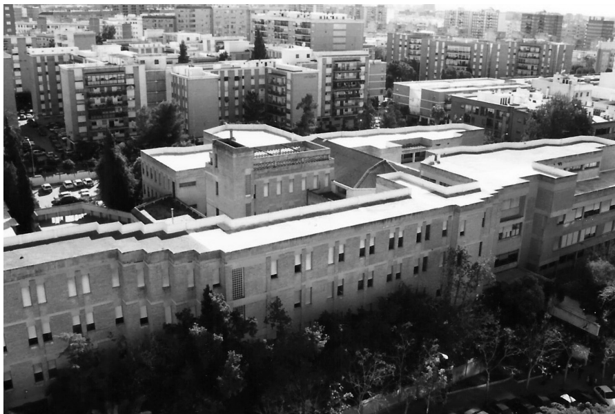
Colegio de Santa Joaquina de Sevilla.

En la nueva ubicación el centro comenzó a llamarse “Colegio Santa Joaquina de Vedruna”. El ayuntamiento le puso el nombre de la fundadora a la calle donde se construiría la entrada de alumnas, y la puerta principal daría a la calle Espinosa y Cárcel, apellidos de un erudito cronista de la ciudad. Ambas calles estaban por aquel entonces semiurbanizadas y durante unos años, en los recreos del comedor, salían las alumnas a jugar a una zona de la calle Santa Joaquina. Se veía campo y las vallas del colegio Portaceli a lo lejos.