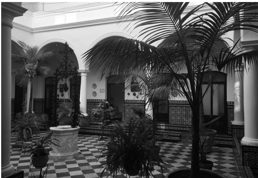
Patio del Colegio Nuestra Señora del Carmen de San Fernando.

de cuatro hermanas se encarga del asilo de niñas huérfanas de San Fernando. Se les proporciona una casa en malas condiciones en la calle Real. El 1 de enero de 1865 se trasladaron a la Plaza de la Viñuela.