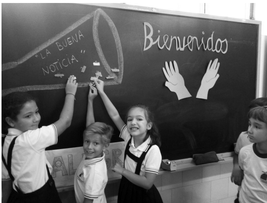
Colegio de la Sagrada Familia de Sevilla.