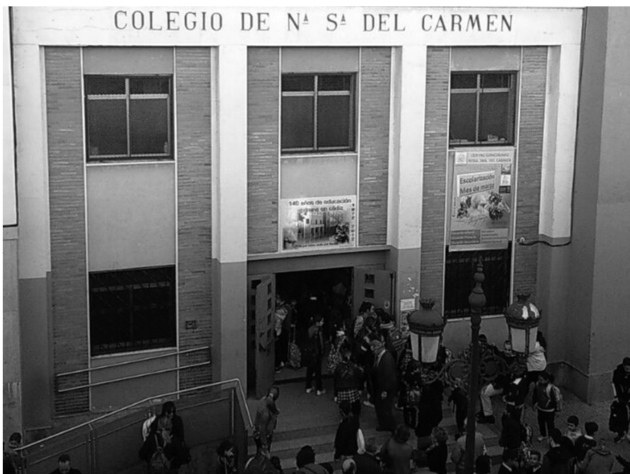
Colegio Nuestra Señora del Carmen de Cádiz.

Las Carmelitas de la Caridad, después de su fuerte expansión por las diócesis catalanas, se abren camino hacia otros puntos de la geografía española. A Andalucía llegaron a finales de 1859 para atender el hospital de Barracones en San Roque (Cádiz) con motivo de la guerra con Marruecos. Concluida la guerra,