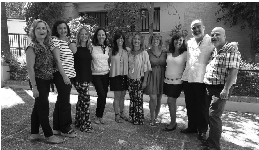
Equipo Directivo del Colegio de Santa Joaquina de Sevilla.

Hoy la Fundación Vedruna Sevilla es una institución sólida y reconocida en el sector educativo con casi 2000 alumnos, un 10% con necesidades educativas especiales, el centro goza de una amplia oferta educativa desde infantil hasta bachillerato. A esta amplia oferta hay que añadirle la escuela profesional que ofrece 8 ciclos de grado superior de distintas familias profesionales. Una escuela