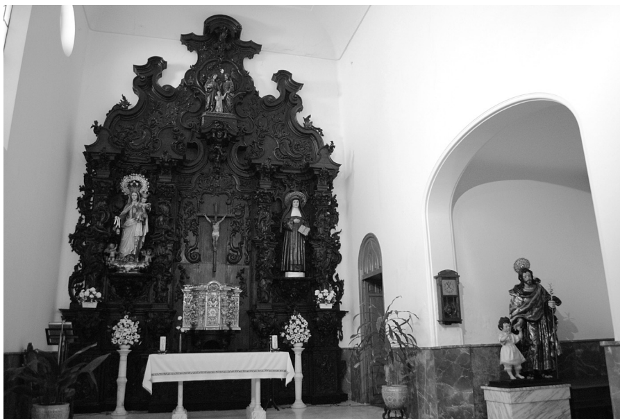
Capilla del Colegio de la Sagrada Familia de Sevilla.