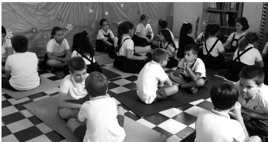
Colegio de la Sagrada Familia de Sevilla.

El 13 de marzo de 1897, por escritura pública, se cedió gratuitamente a la congregación las tres casas en las que estaba edificado el colegio con cuatro condiciones, figurando entre ellas que las fincas se destinarían perpetuamente a enseñanza privada gratuita. A lo largo de los primeros años fueron surgiendo grandes dificultades económicas. En 1905 el número de alumnas gratuitas que asistían diariamente a la escuela ascendía a trescientas, aunque eran más las matriculadas. Por real orden de 20 de septiembre de 1909 el colegio fue clasificado como de beneficencia particular.