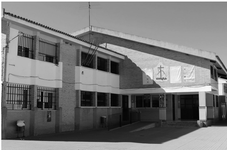
Colegio Nuestra Señora del Carmen de La Palma del Condado.