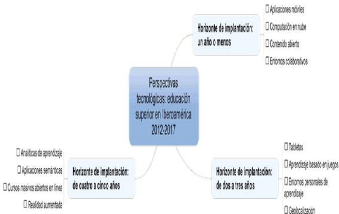
Figura 1. Perspectivas tecnológicas: Educación superior en Iberoamérica 2012-2017. Fuente: NMC y UOC, (2012). Perspectivas Tecnológicas: Educación Superior en Iberoamérica 2012–2017. Un Análisis Regional del Informe Horizon del NMC y la UOC. Disponible en: http://openaccess.uoc.edu/webapps/o2/bitstream/10609/17021/6/horizon_iberoamerica_2012_ESP.pdf

Es así que el Objetivo que se persigue con el presente Proyecto es: