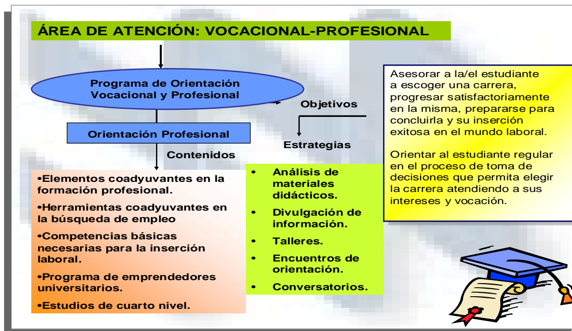
Gráfico 4. Orientación Profesional.