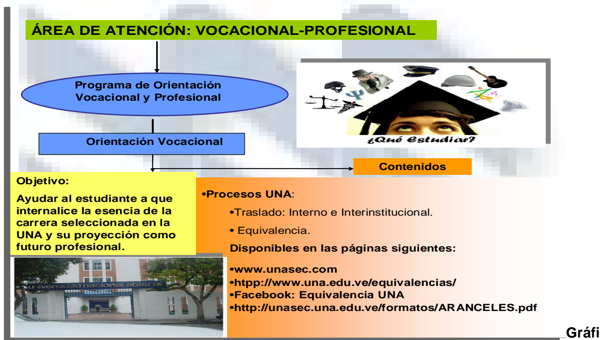
Gráfico 3. Orientación Vocacional.