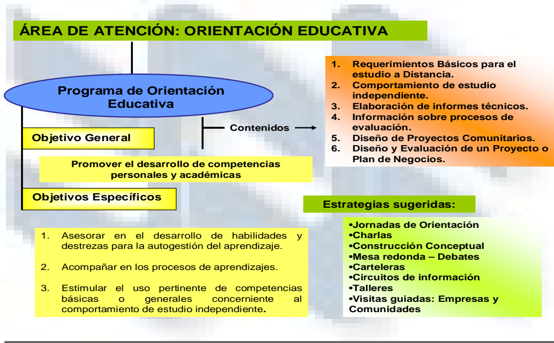
Gráfico 2. Orientación Educativa.