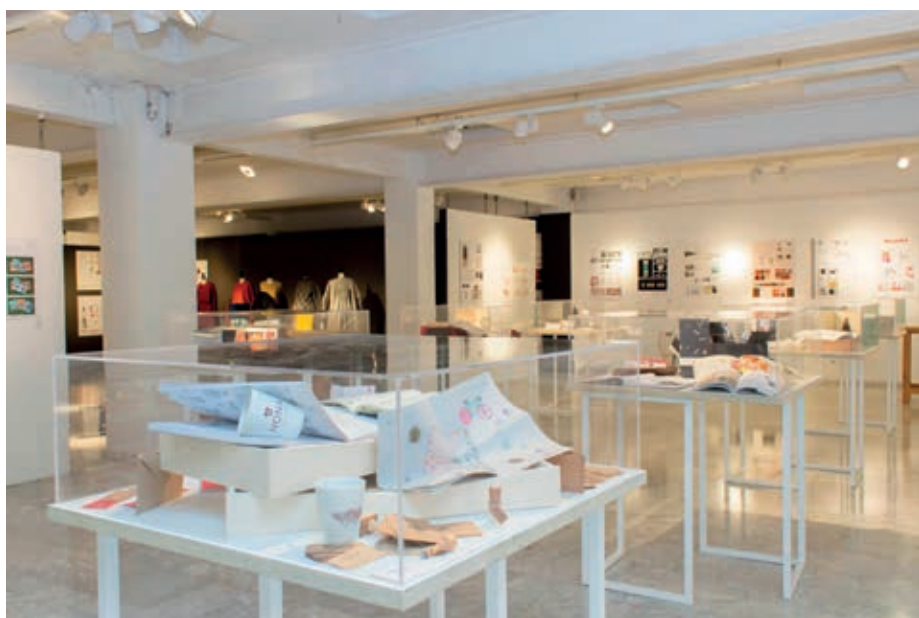
Exposición Trabajos Fin de Estudios . 2015.