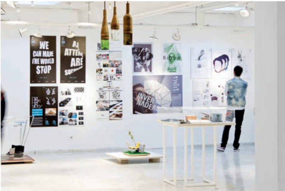
Exposición Proyectos finales . 2013.