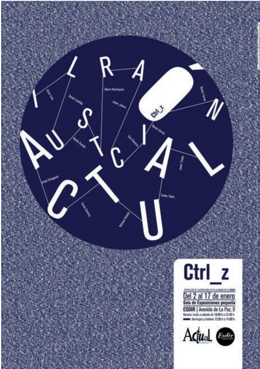
Cartel de la exposición Ctrl_z . Carlota Carrillo. 2016.