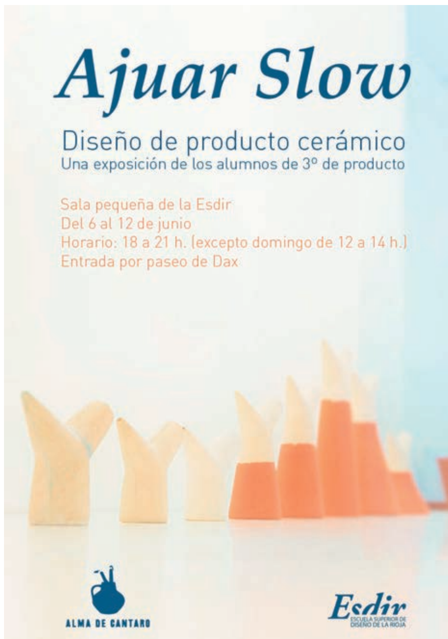
Cartel de la exposición Ajuar slow . 2016.