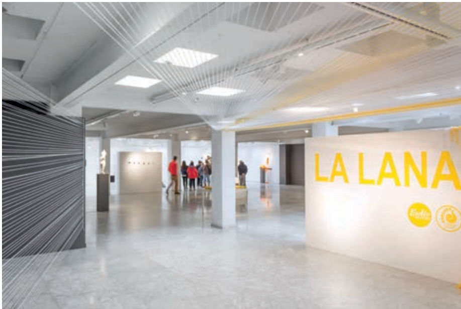
Exposición el objeto. La lana. 2015.