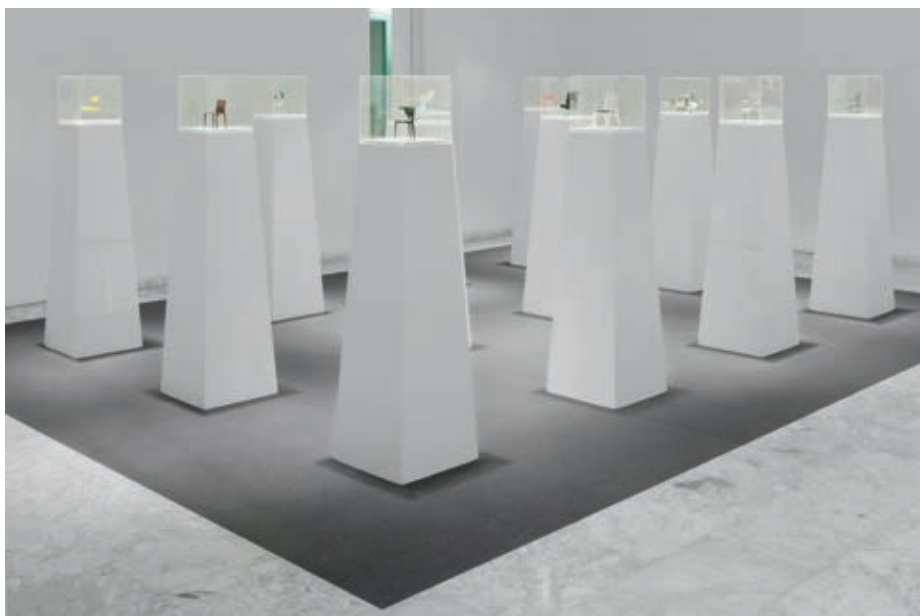
Exposición Vitra Dimensions of Design. 100 Classical Seats. 2012.