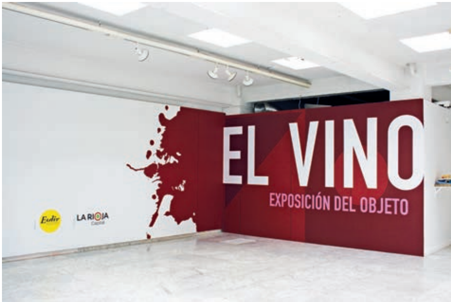
Exposición el objeto. El vino. 2011.