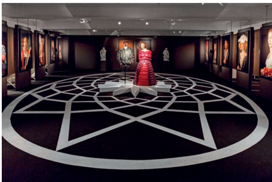
Exposición Colección Renacimiento: de la moda pintada a la fotografía de moda . 2015.