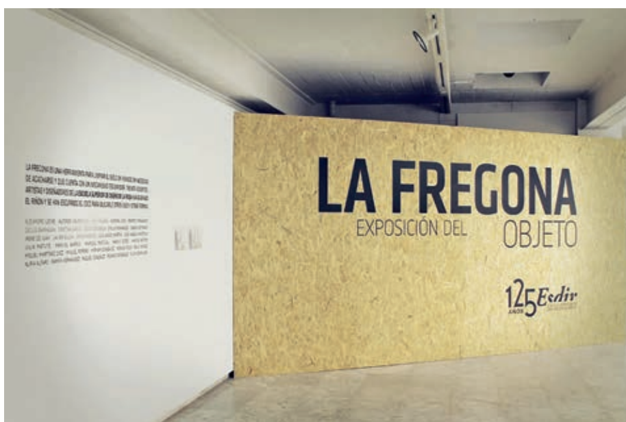
Exposición el objeto. La fregona. 2012.