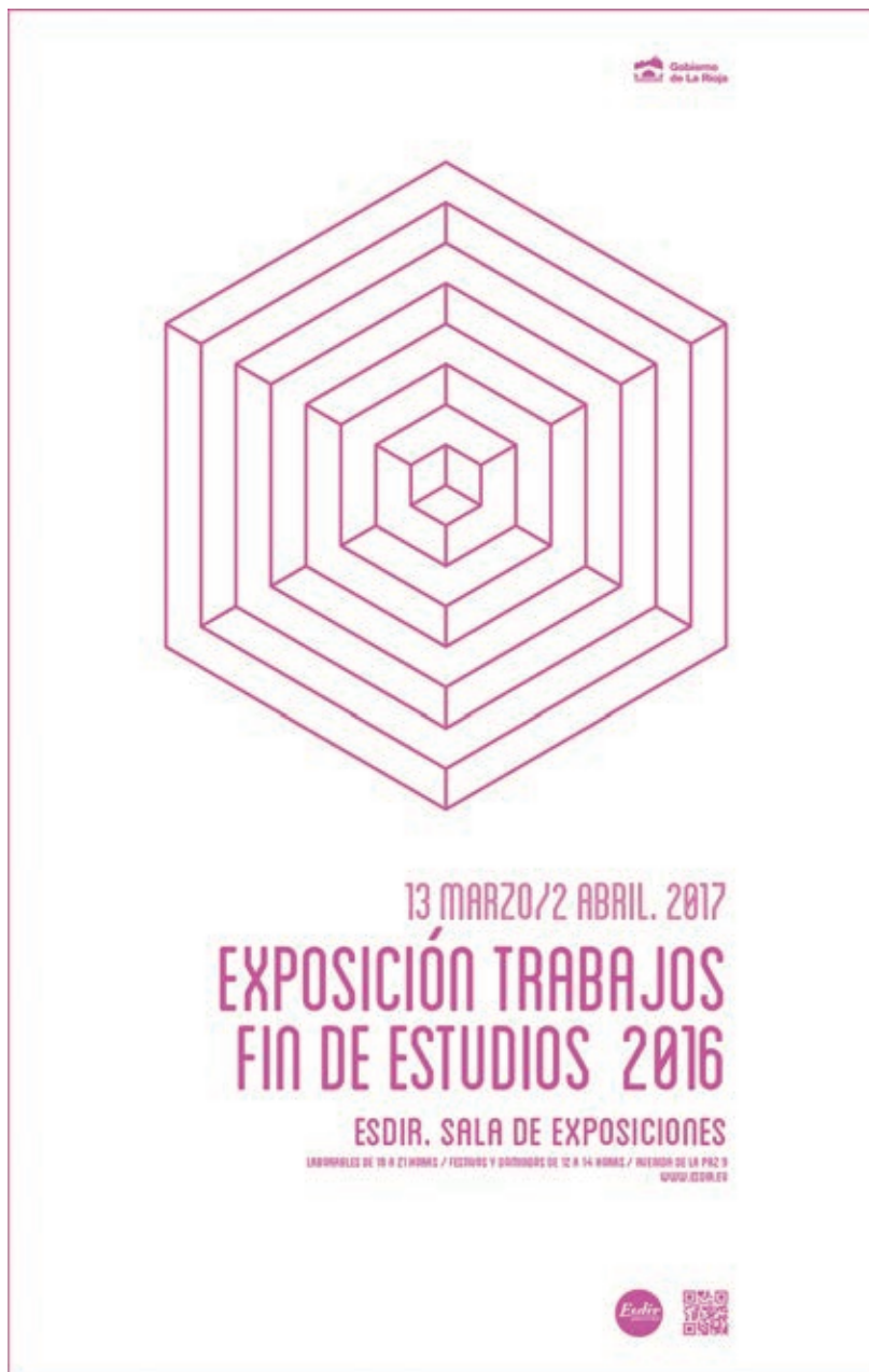
Cartel de la exposición Trabajos Fin de Estudios . 2016.