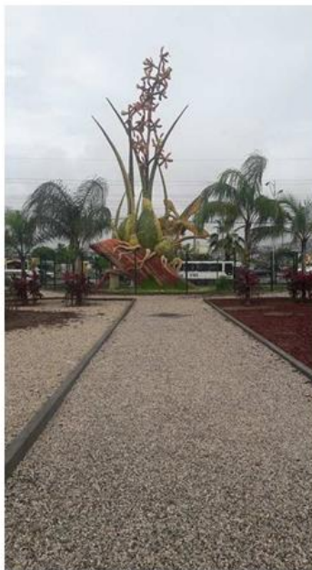
Fig. 1. Monumento a la Encyclia angustiloba Schltr.

Una de principales acciones para fortalecer la participación comunitaria es el establecimiento de especies emblemáticas, representativas de una entidad a conservar. En este contexto, es que las especies emblemáticas pueden jugar un papel importante en la atracción de recursos para la conservación del entorno, beneficiando la cultura local y al ecosistema. La especie Encyclia angustiloba Schltr cuenta con un monumento que constituye una importante atracción turística (Ver figura 1).