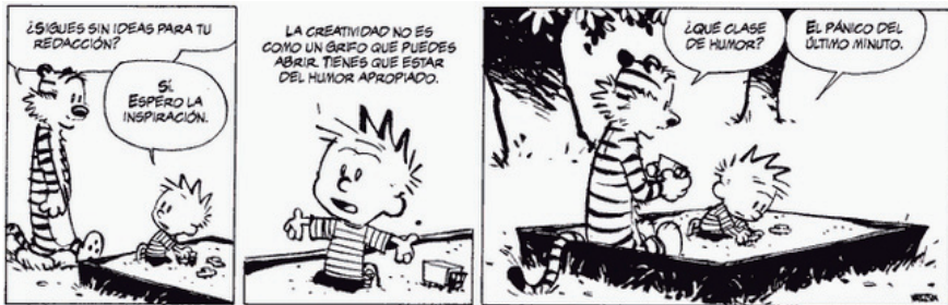
Gráfico 2. Calvin y Hobbes (Watterson, 2005)

En esta misma dirección, el tono general (humorístico, poético, académico) corresponde al estilo que el docente quiera darle tanto a su clase como a sus asignaciones o bien a la disciplina de estudio.