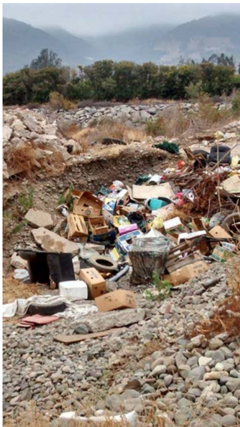
Imagen 3. Basural clandestino en zona baja del río Ligua. Próximo a puente Illalolén, comuna de La Ligua