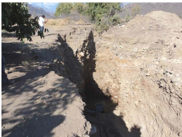
Imagen 2. Dren construido para la extracción ilegal de agua por la Empresa agrícola Liguana. Sector de Alicahue, comuna de Cabildo

Fuente: Archivo de MODATIMA, provincia de Petorca. Tomada en el año 2012.