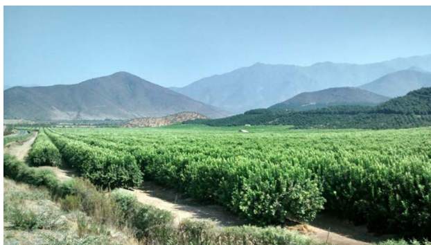
Imagen 1. Cultivo de frutales de la empresa agrícola Los Ángeles, propiedad del empresario Juan Ruiz Tagle. Sector de La Mora, comuna de Cabildo

Tomada en el año 2013.