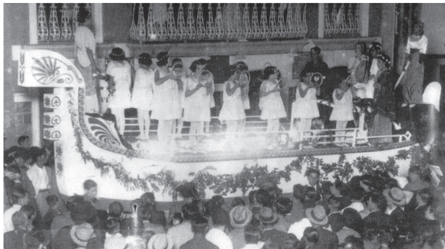
Representación del Carro de 1935 «Los Cuatro Elementos».

protagonistas participa un coro de doce niños, que simboliza los meses del año. Se trata de una pieza muy contextualizada en su época, en la que se alaba la fusión del hombre con la naturaleza, y que estilísticamente se corresponde con otros textos coetáneos de las Fiestas Lustrales como el actual Diálogo del Castillo y la Nave (original de este mismo año 1875) y de la Loa de Recibimiento (de 1880), ambos del propio Rodríguez López 5 .