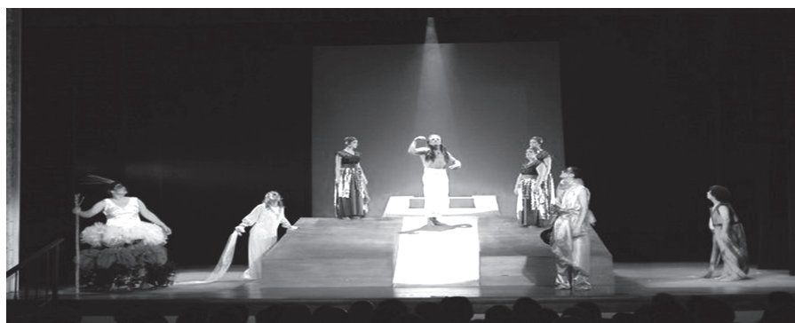
Carro Alegórico y Triunfal «Los Cuatro Elementos», Teatro Circo de Marte, 16 de Julio de 2010.