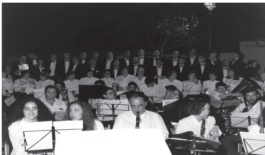
«Carro Paralelo», Bajada de la Virgen de 1995.