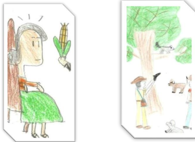
Figura 1 y 2. El huapango y el elote (Esc. Prim. 2010); La fiesta del mapache (Luis, Huitzitzilin, 2010)