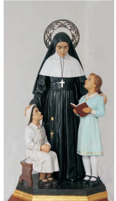
Imagen 1. Santa Emilia de Rodat. Colegio de la Sagrada Familia de Alcázar de San Juan

casas en las que residían 300 religiosas dedicadas a la enseñanza y a diversas obras de apostolado como internados, escuelas rurales, cuidado de enfermos, casas de refugio y orfanatos 4 .