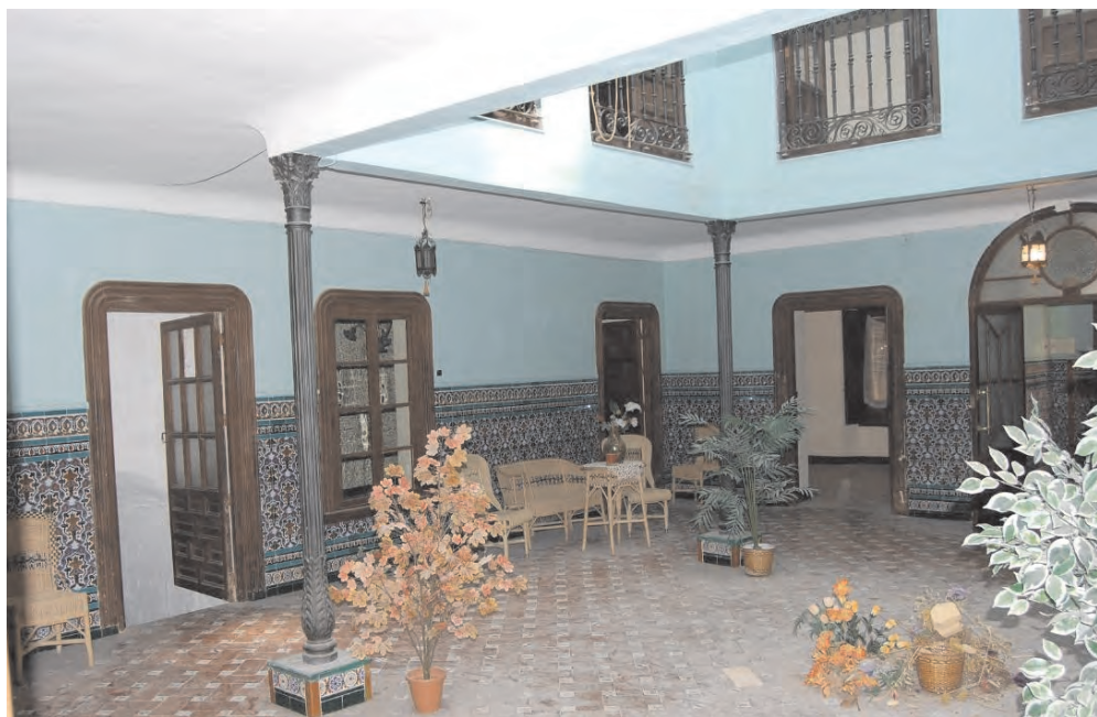
Imagen 2. Patio interior de la casa de la calle Convento, nº 5

15. Según observamos en el plano aparecen ocho columnas. Pudo deberse a un error en su ejecución o bien a una eliminación posterior.