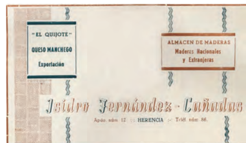
Imagen 3. Empresas Libros de Feria 1943, 1950, 1951 y Bodegas Cañadas etiqueta de la marca