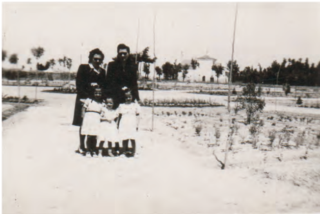
Imagen 6. La autora y sus hermanas con su madre y su tía en el parque municipal en 1946 y merienda familiar en los Pozos del Agua