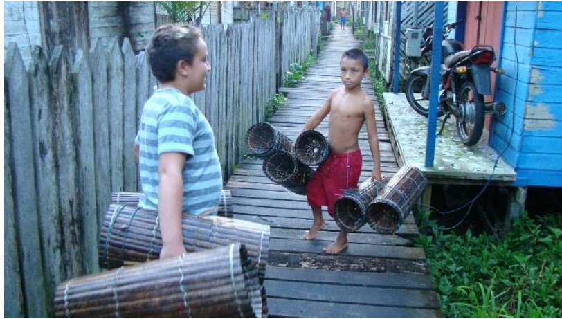
Imagem 4 – Crianças indo colocar matapi no rio Piriá.

A pesca do camarão de água doce por meio da utilização do manuseio do matapi pelas crianças se constitui uma prática cultural secular herdada dos índios que viviam na região do Marajó, sendo uma atividade frequente no cotidiano delas. Conforme narrado pelas crianças, é feito de material extraído da natureza, fibra vegetal (tala de arumã) e tem formato cilíndrico (imagem 4), medindo cerca de 50 cm de comprimento e 25 cm de diâmetro, com um funil nas suas extremidades que facilita a entrada do camarão ao mesmo tempo em que dificulta sua saída; a isca é feita de farinha de mandioca, base alimentar dos ribeirinhos, portanto, fácil de encontrar.