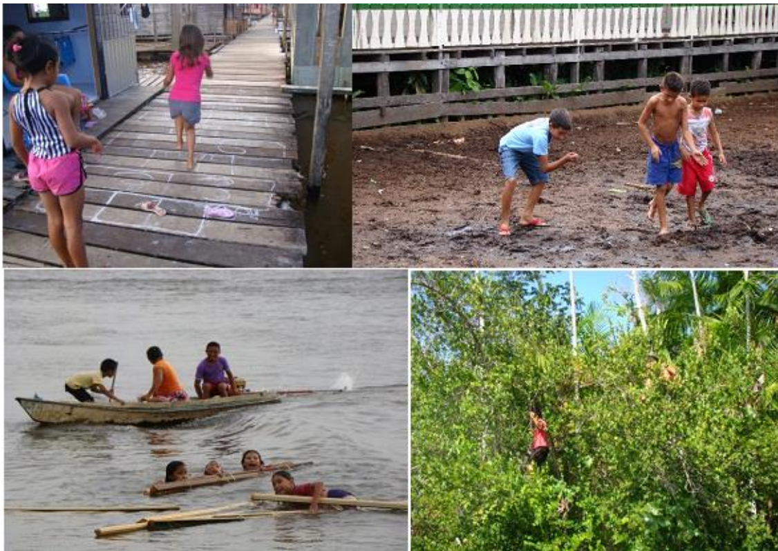
Imagem 2 – Crianças no exercício de suas práticas culturais na Vila do Piriá.

enorme plasticidade da renovação das formas e dos conteúdos, poderão propor e sugerir outros modos de ver o mundo que não aqueles cristalizados nas culturas dominantes” (SARMENTO, 2017, p. 6), como podemos contemplar nas imagens a seguir: