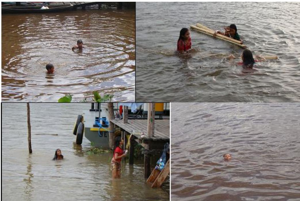
Imagem 3 – A prática cotidiana do banho de rio.

[...] partes significativas das crianças ribeirinhas, aproximadamente dos três aos cinco anos de idade, dominam habilidades necessárias do ato de nadar e adquirem habilidades para andar em cima de troncos flutuantes, como o de buriti, sustentando-se em troncos de árvores, no próprio casco, sobre as costas de outras pessoas, ficando de pé nas partes mais rasas do rio até conseguir a habilidade necessária para nadar sozinhas (COELHO; SANTOS; SILVA, 2015, p. 65)