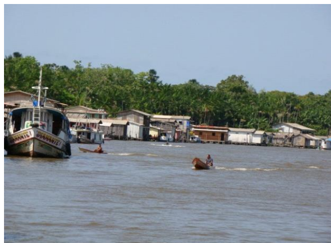
Imagem 1 – Distrito Vila do Piriá – Currealinho/Pará/Brasil

Localizada às margens do rio Piriá, é considerada área interiorana, de várzea. O grande porte da Vila para os padrões amazônicos nos chamou a atenção, principalmente pelo número considerável de crianças existentes no espaço geográfico. A imagem a seguir mostra a frente da Vila às margens do rio Piriá.