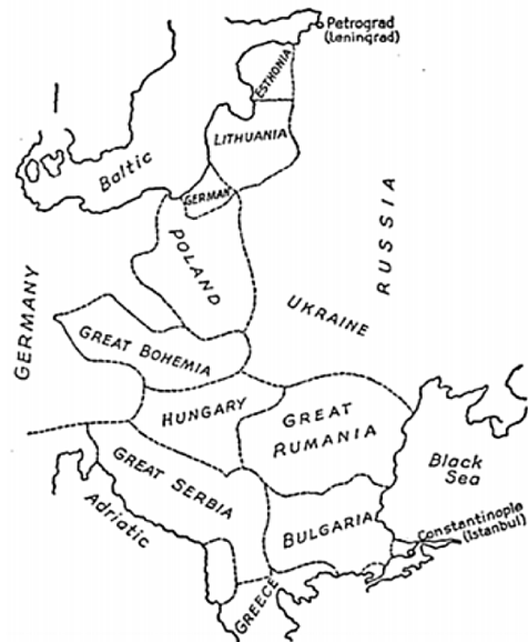
Figura 2. Modelo de Estados tapón entre Alemania y Rusia

sibles (Heffernan, 2003). La diferencia entre una obra y otra consistió en la estrategia para evitar dicha alianza. En 1919 Mackinder propuso la creación de "Estados tapón" ( buffer states ) que dividirían Europa en dos. Estos Estados tapón, en conjunto, tendrían salida a los mares Báltico, Adriático y Negro y servirían para separar físicamente Alemania de Rusia (figura 2). Dentro de la estrategia, los Estados más expuestos a la agresión prusiana, Polonia y Bohemia, también serían los más civilizados (Mackinder, 1942, p. 116).