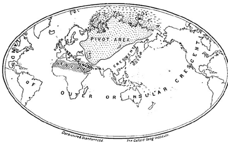
Figura 1. Modelo de la región pivote o corazón continental

mundial a partir de la explotación de los recursos continentales de la región pivote: la moderna y eficiente maquinaria alemana sumada a la gran masa demográfica rusa (Mackinder, 1904). Para contrarrestar esa superioridad geoestratégica, Mackinder propuso una política de “equilibrio de poder” entre la zona tradicional de influencia de Gran Bretaña –por el acceso a la navegación– y la zona más circundante a la región pivote. Es decir, que Inglaterra formara un equilibrio de poder entre el llamado “cinturón exterior” ( outer crescent ), conformado por Gran Bretaña, Canadá, Estados Unidos, Sudáfrica, Australia y Japón, y el “cinturón interior” ( inner crescent ), donde se hallan Alemania, Austria, Turquía, India y China 12 (Mackinder, 1904, p. 436).