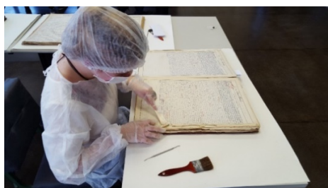
Figura 2. Curso de reparos de documentos . Arquivo Público do Paraná.