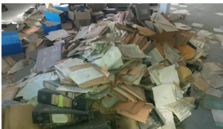
Figura 1. Material encontrado em uma sala, que seria descartado.

As atividades iniciais foram motivadas pela necessidade de dar tratamento arquivístico ao acervo documental, que poderão contribuir com novos elementos sobre as origens da indústria no Estado do Paraná. Eles foram encontrados em estado de abandono dentro de um cofre e em vias de descarte (Figura 1).