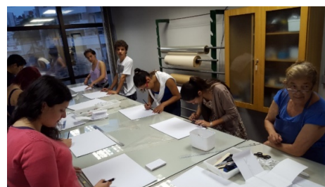
Figura 3. Curso para construção de caixas de papel para acondicionamento de documentos (Fonte: Chaves, 2015).