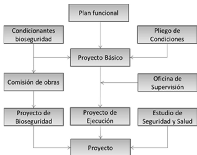
Figura 1. Diagrama de bloques de la metodología utilizada.

Z2: zonas interiores contiguas a las críticas Z3: zonas interiores no incluidas en Z1 y Z2 Z4: zonas exteriores CS: centros de salud