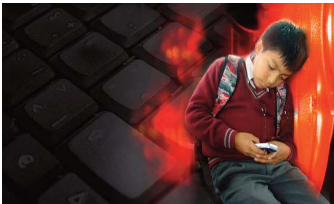
■ Niño mapuche conectado con su comunidad. Fotos y montaje de Enrique Martínez-Salanova

Me interesa «rastrear» esas conexiones de base entre la Educación Artística y la Educomunicación, con el objetivo de relacionarlas