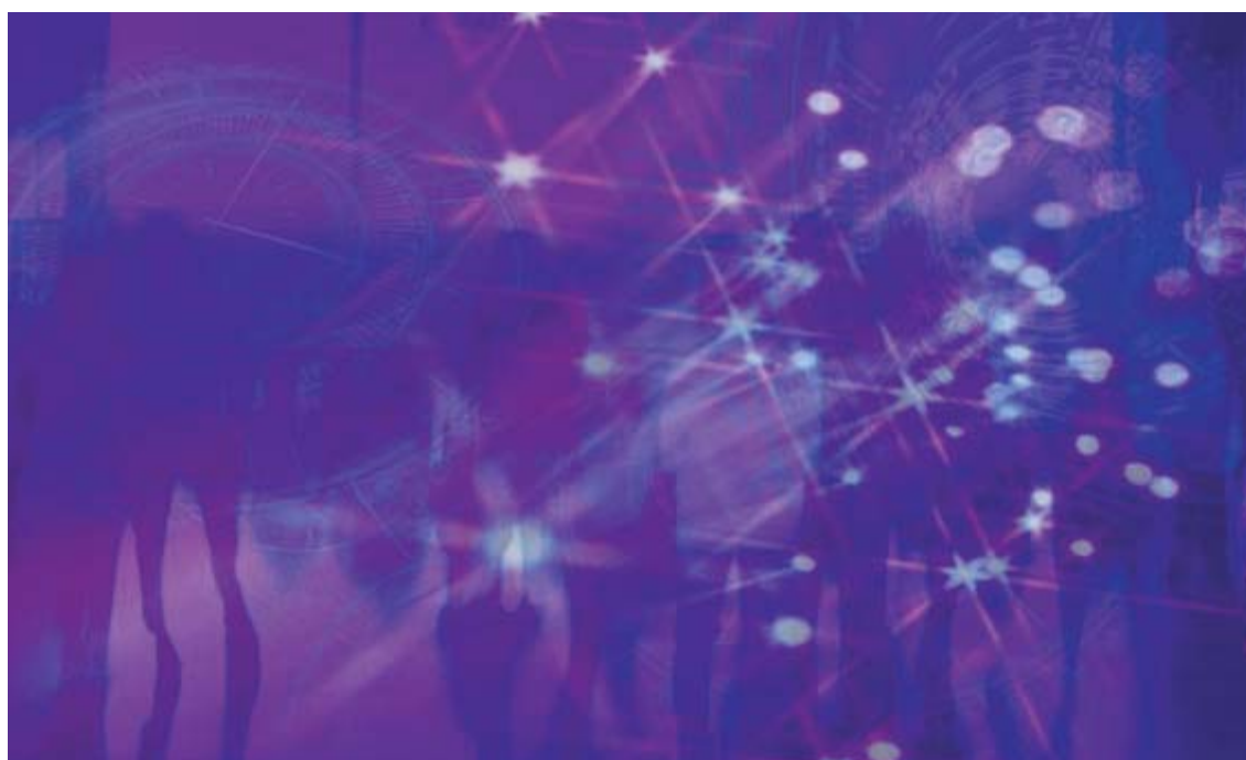
Ciudadanía y redes.