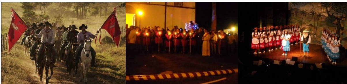
Imagem 1 - Chegada da Folia Renovação Cristã na Fazenda Mateus Machado, 2012. Foto: Fernanda Cordeiro / Imagem 2 - Benção e levantamento do Mastro, 2012. Foto: Amanda Alexandre / Imagem 3 - Auto natalino “As Pastorinhas”, 2012. Foto: Amanda Alexandre.

É chegado o dia mais esperado: o Domingo de Pentecostes. Após as alvoradas, segue o Cortejo Imperial, saindo da casa do Imperador 3 rumo à igreja. Depois da missa é realizado o sorteio do próximo Imperador e dos mordomos. Terminado o sorteio, um novo cortejo sai da igreja rumo à casa do atual imperador. Nesse cortejo seguem: o Imperador e sua família ocupando lugar de honra na procissão, a Irmandade do Santíssimo Sacramento, a Procissão das Virgens (meninas vestidas de branco), as bandas de Couro e Phôenix e, por fim, a comunidade que acompanha para receber do Imperador os cumprimentos e as tão esperadas Verônicas de Alfenim e os pãezinhos do Divino 4 . Na casa do Imperador fica exposto o altar em homenagem ao Divino, exibindo a Bandeira, a Coroa e o Cetro – símbolos do Espírito Santo.