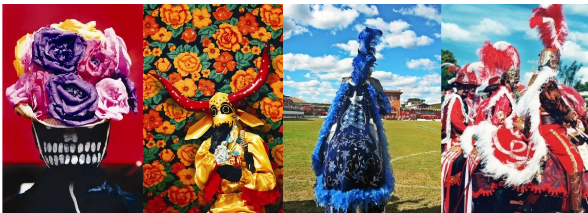
Imagem 12 - Mascarado – A morte de chapéu, 1992.Foto: Antonio Bandeira / Imagem 13 - Mascarado Curucucu, 1992.Foto: Antonio Bandeira / Imagem 14 - Rei Cristão (Azul), 2013.Foto: Amanda Alexandre / Imagem 15 - Rei e Cavaleiros Mouros, 1992.Foto: Antonio Bandeira

A segunda-feira começa com o Reinado de Nossa Senhora do Rosário: o cortejo, a missa e a festa do Reinado – os reinados e juizados seguem a mesma estrutura dos cortejos do Imperador do Divino: o cortejo busca o rei e a rainha em sua residência, seguindo para a igreja onde acontecerá a missa. Após a missa o cortejo retorna da igreja para a residência do rei e rainha onde acontece a “festa” e são servidos os quitutes para a comunidade. Esse movimento ocupa todo o período da manhã e às 13h dá-se continuidade ao segundo dia da encenação das Cavalhadas.