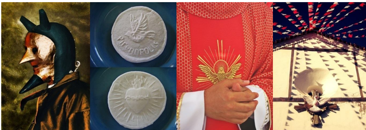
Imagem 16 - Mascarado – Capeta, 1992. Foto: Antonio Bandeira / Imagem 17 - Verônicas de Alfenim. Foto: Adriano Curado / Imagem 18 - Detalhe da veste sacerdotal com o Divino representado, 2013. Foto: Amanda Alexandre / Imagem 19 - Igreja Matriz decorada com representação do Divino, 2013. Foto: Amanda Alexandre