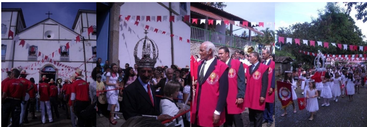
Imagem 4 - Chegada do Cortejo Imperial à Igreja, 2012.Foto: Amanda Alexandre / Imagem 5 - Saída do Cortejo Imperial após a missa, 2012.Foto: Amanda Alexandre / Imagem 6 - Irmandade do Santíssimo Sacramento no Cortejo Imperial, 2012.Foto: Amanda Alexandre / Imagem 7 - Procissão das Virgens no Cortejo Imperial, 2012.Foto: Amanda Alexandre

Esses objetos possuem um status sacro : na procissão as pessoas se debruçam para tocá-los e pedir graças. Todas essas atividades – que iniciaram às 4h da manhã – prolongam-se até o horário do almoço. E é preciso estar atento: a abertura das Cavalhadas começa às 13h no campo conhecido como “Cavahódromo” 5 . Durante toda a tarde do domingo acontece o primeiro dos três dias de encenação das Cavalhadas. Ainda no domingo, na missa à noite, temos a posse do novo Imperador, que junto com os mordomos já começam a pensar os preparativos para a festa do próximo ano. O novo ciclo se inicia antes mesmo que o ciclo corrente termine.