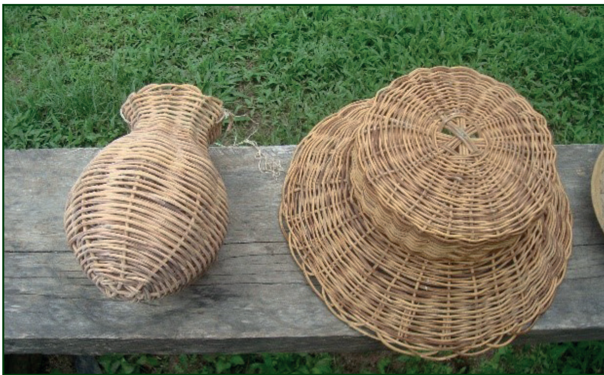
Figura 3 Canastas y sombreros elaborados con lianas

de Chilmá Bajo mantiene este uso, a pesar del creciente acceso que tienen a productos farmacéuticos industriales.