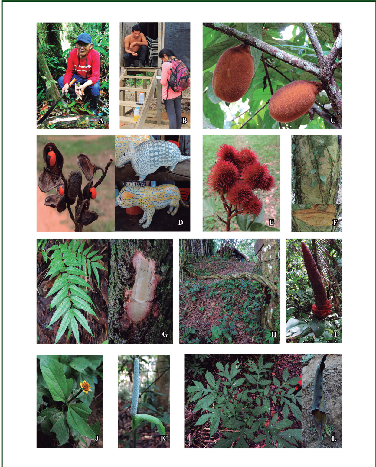
Figura 2. A. Informante experto. B. Entrevistas. C. Plantas alimenticias: Copasú ( Theobroma grandiflorum ). D. Plantas artesanales: Huayuro ( Ormosia bopiensis ) y figuras talladas. E. Plantas colorantes: Achiote ( Bixa orellana ). F. Plantas para el aserrió: Quiabordón ( Aspidosperma aff. tambopatense ). G. Plantas para construcción: Cedro ( Cedrela odorata ). H. Plantas culturales: Ayahuasca ( Banisteriopsis caapi ). I. Plantas medicinales: Caña caña ( Costus scaber ). J. Botoncillo ( Heliopsis buphthalmoides ). K. Sacha bufeo ( Anthurium aff. oxycarpum ). L. Plantas tóxicas: Jergón sachá ( Dracontium lorentense ).