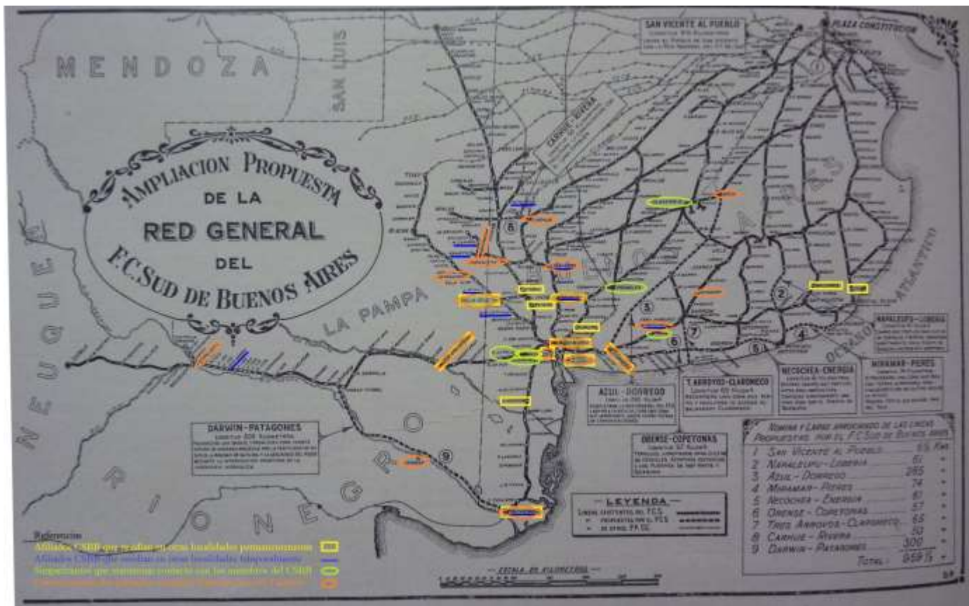
Imagen 2. Redes regionales vinculadas al CSBB, 1911-1921.

Elaboración del autor en base a ACSBB. Mapa extraído de LA NUEVA PROVINCIA. Centenario de Bahía Blanca. La Nueva Provincia, Bahía Blanca, 1928, p. 600.