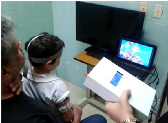
Figura 8. Opción terapéutica disponible en el CIREN: Estimulación cerebral no invasiva.

publicados en el mundo que demuestra la seguridad de la rTMS en niños (123). La asociación de NIBS y rehabilitación también puede llevar el proceso restaurativo a un mejor resultado clínico. En un ensayo clínico doble ciego se demostró que los pacientes con enfermedad cerebrovascular que recibieron una asociación de programa de rehabilitación intensiva y rTMS, tuvieron mejores resultados en la función motora manual que los pacientes que sólo reciben rehabilitación intensiva (124).