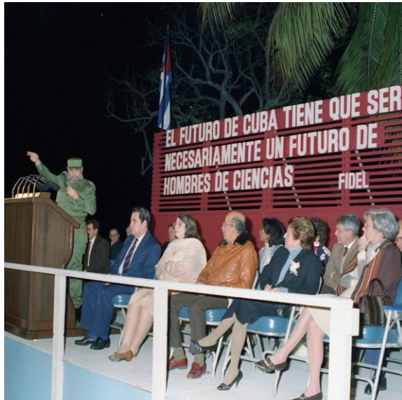
Figura 1. Inauguración del CIREN el 26 de febrero de 1989 por el Líder de la Revolución cubana Fidel Castro Ruz.

nombre largo que los cubanos acortaron rápidamente y, aunque el nombre fue cambiado a Centro Internacional de Restauración Neurológica pocos años más tarde (CIREN), muchas personas todavía lo llaman brevemente “Neurotrasplante”.