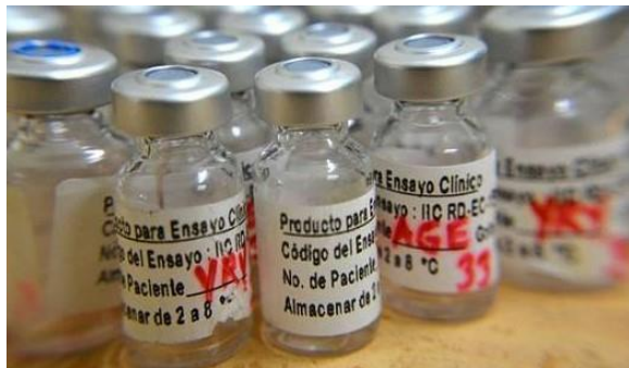
Figura 9. Producto NeuroEPO aplicado en el CIREN como ensayo clínico fase II-III para los pacientes con Enfermedad de Parkinson.

y la investigación han demostrado, principalmente en modelos animales que la EPO puede actuar como un agente neuroprotector. La investigación de nuestro grupo ha demostrado que la EPO también puede contribuir a restaurar el cerebro dañado, y promover la plasticidad (152,153). Hemos demostrado en un estudio de fase I con pacientes parkinsonianos que la EPO administrada por vía periférica es bien tolerada (154) y en colaboración con el Centro de Inmunología Molecular está en curso un estudio de fase II de mayor escala (Figura 9).