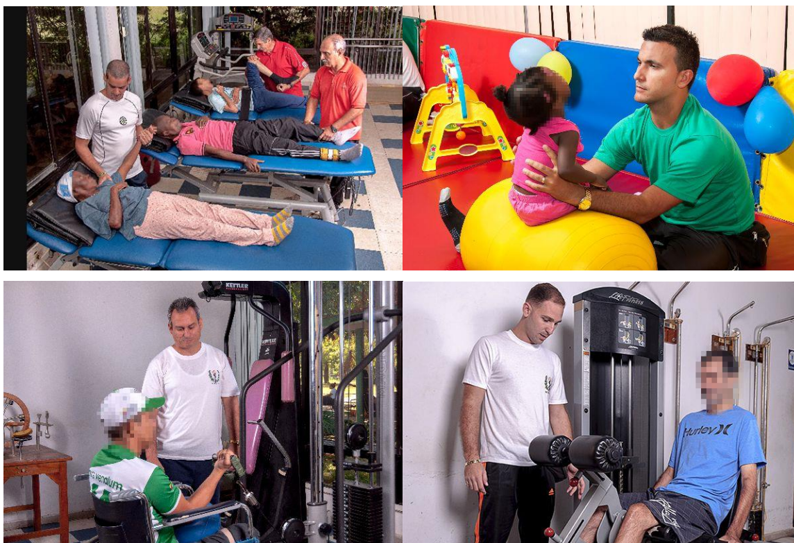
Figura 7. Neurorrehabilitación multifactorial intensiva como parte del Programa de Restauración Neurológica. Fotos de atención en la Clínica de lesiones estáticas encefálicas del adulto; Neuropediatría; Enfermedades raquimedulares, neuromusculares y esclerosis múltiple; Trastornos del movimiento y neurodegeneraciones.

La rehabilitación se practica seis horas al día (tres horas los sábados) en ciclos de cuatro semanas. El primer ciclo se organiza en dos fases. La primera fase tiene como objetivo mejorar la capacidad de trabajo de los pacientes, la segunda persigue la formación de habilidades específicas para la marcha o las transferencias, las actividades de la vida diaria, el lenguaje y la cognición, entre otros (87,88). Métodos originales, aprovechando también los sistemas internacionales y las nuevas tecnologías han estado en desarrollo desde