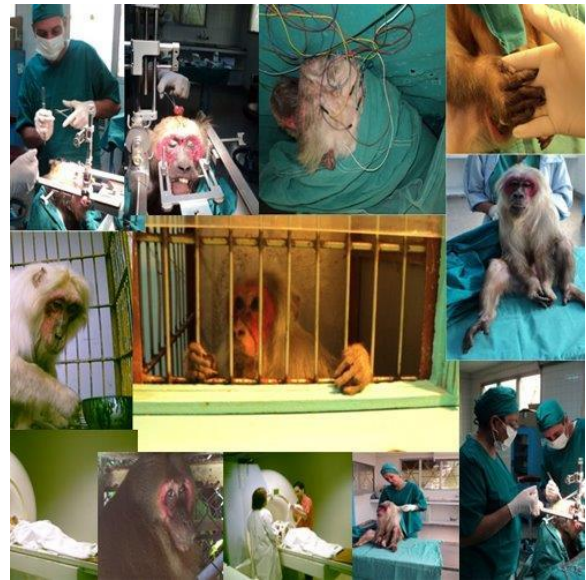
Figura 4. Modelos animales de enfermedades.

tanto, como un candidato potencial para tratar la afección (Figura 4).