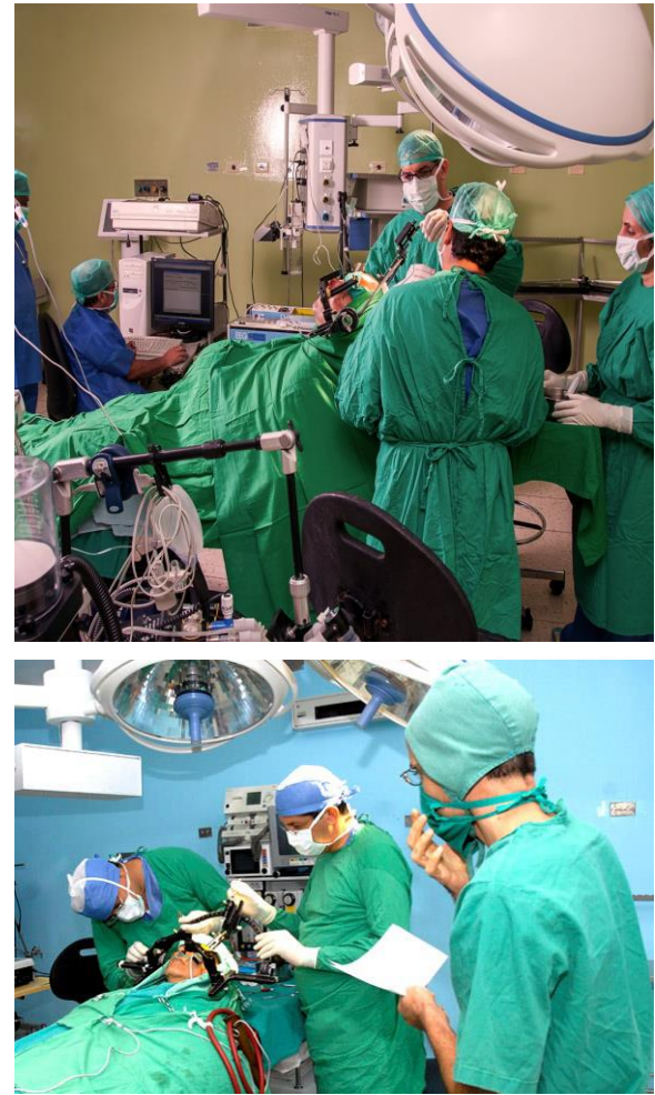
Figura 2 A y B. Neurocirugía funcional en los trastornos del movimiento.

La primera operación de subtalamotomía para el tratamiento de la EP se realizó en el CIREN en 1995, con el valioso asesoramiento de nuestro fiel amigo el Profesor José Ángel Obeso Inchausti, neurólogo y neurofisiólogo, y un grupo de reconocidos expertos internacionales (6). La experiencia adquirida anteriormente permitió una mejor localización del núcleo subtalámico (7,8) lo que sin duda ha contribuido a reducir las complicaciones como los movimientos balísticos observados en monos subtalamotomizados. En una primera serie se utilizó una lesión unilateral en el núcleo subtalámico dorsolateral con excelentes resultados después de tres años de seguimiento (9).