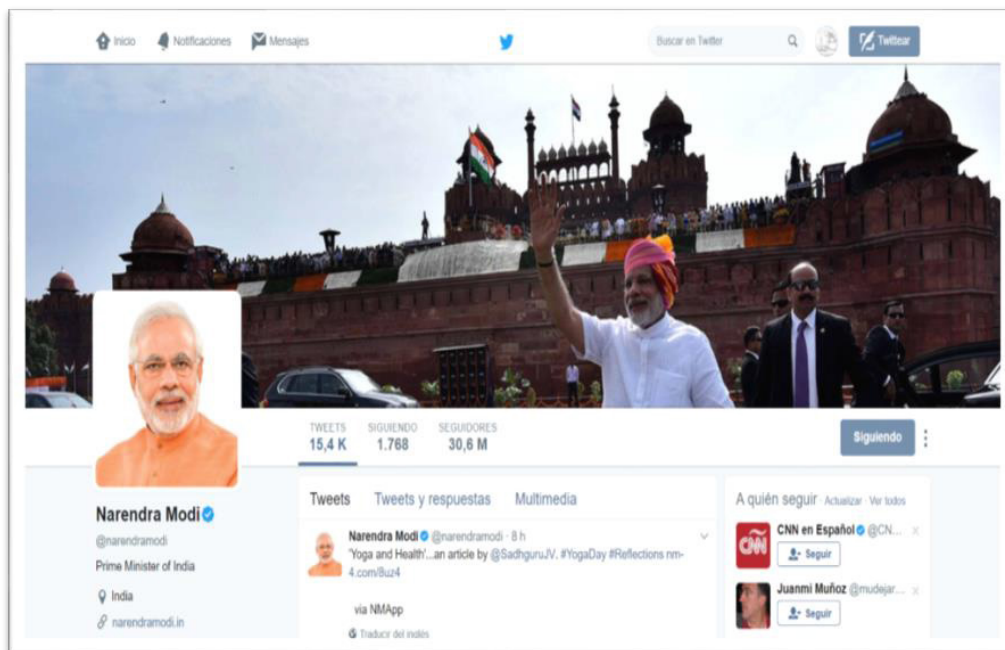
Figura 3. Cuenta del primer ministro de India en la Twitter

Para algunos, la política del Gobierno de Modi y sus mayorías parlamentarias esbozan un inequívoco incremento del nacionalismo populista. La retórica Make in India (Hacer en la India) del partido gubernamental, las omnipresentes campañas políticas del primer ministro en las redes sociales (como es el caso de su iniciativa sobre la limpieza 9 o la práctica del yoga 10 ) están convirtiendo al partido de las castas altas y los hombres de negocios en un partido con tintes ultranacionalistas 11 . La campaña electoral ha puesto