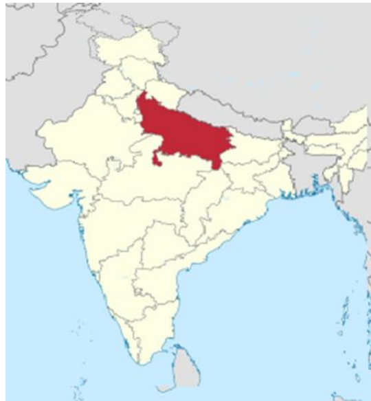
Figura 2. Pie de imagen: El estado de Uttar Pradesh

La formación nacionalista hindú Bharatiya Janata Party (BJP) ha obtenido una arrolladora mayoría al ganar 312 de las 403 circunscripciones electorales en Uttar Pradesh, un estado de gran complejidad religiosa y social, situado en el norte de India, con 200 millones de habitantes y donde se han registrado 140 millones de votantes. Los votos del superpoblado Uttar Pradesh proporcionan 31 senadores, el mayor número de representantes en la Cámara Alta. Modi solo ha sido derrotado por el momento, y por un ajustado margen, ante la formación de los Gandhi en los estados sureños de Goa y Punjab 3 .