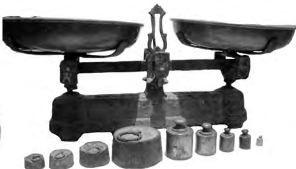
Balances comercials i jocs de Pesos de llautó i ferro comercials apareixen inscrits el seu pes, visible, època moderna, els quals han arribat a finals del segle XX.

Sobre els pesals que s'atribueix a Agramunt amb marca de puig cimati i costats rectes o forma creu, sembla que possiblement Crusafont desconeix la cronologia de les encunyacions locals de la vila de Bellpuig, que la documentació clarament identifica aquesta vila amb les marques o senyals amb un puig cimati de creu i, en alguns cas, amb flor de llir. Entre els segles XIV i XVI apareixen amb tres cims amb creu al central, i tot fa pensar que s'ha fet un embolic. Entre els símbols heràldics locals hi ha marques de les dues poblacions molts semblants; d'Agramunt no crec que els seus símbols heràldics locals hagin portat una creu.