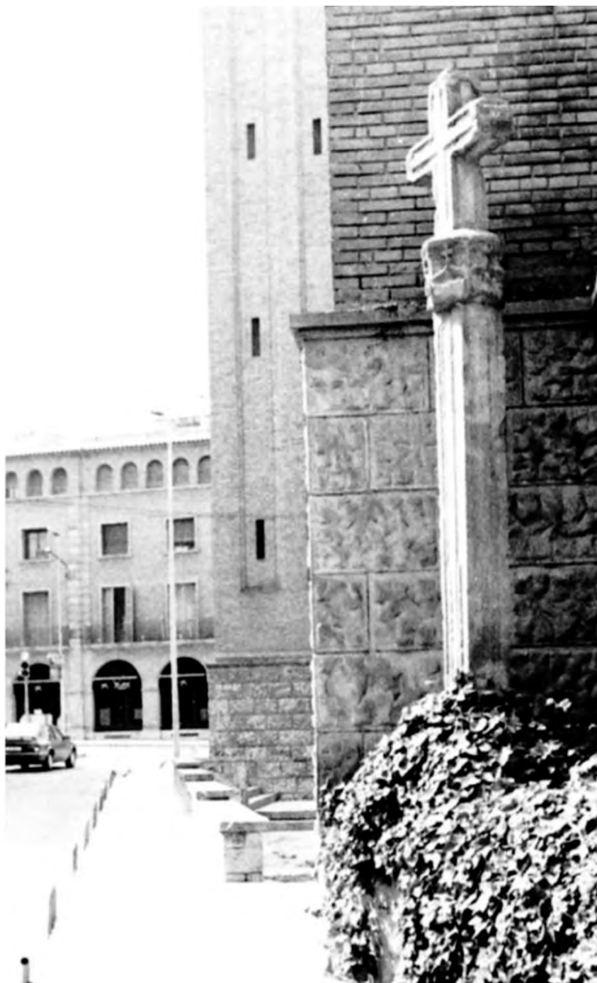
Fotografia de la creu de Mollerussa (any 1993) en la seva anterior ubicació, al darrere de l'església de Sant Jaume i abans de la seva restauració.