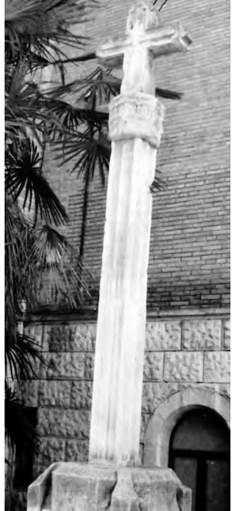
Dues vistes de la creu en la seva actual ubicació, any 2013.

sanejar tota la creu i es va impermeabilitzar amb líquid hidrofugant perquè no l'afectés la humitat; posteriorment van rascar fins trobar la pedra viva. 28 La creu va canviar de lloc, aquest cop al darrere del campanar de la mateixa església de Sant Jaume de Mollerussa, on resta actualment.