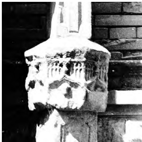
Fotografia del capitell de la creu de Mollerussa de l'any 1993 en la seva anterior ubicació.

Quan em vaig capbussar en l'estudi de la creu de pedra de Mollerussa a principis dels anys noranta del segle XX, no vaig trobar cap font escrita que fes referència ni de l'època ni de l'estil, ni de la seva funció. Fins i tot la gran obra