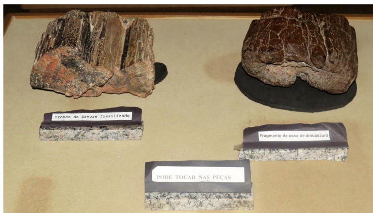
Figura 2. Peças manipulativas do CPHNAMA. À esquerda, fóssil de tronco de árvore; à direita, fóssil de osso de dinossauro; ao meio, placa de orientação.

O toque por si só não garante envolvimento cognitivo por parte do visitante. Portanto, ao se planejar a organização de uma exposição, deve-se avaliar a interpretação que o visitante pode dar aos objetos no contexto da exposição, não apenas a quantidade de peças manipulativas ou contemplativa.