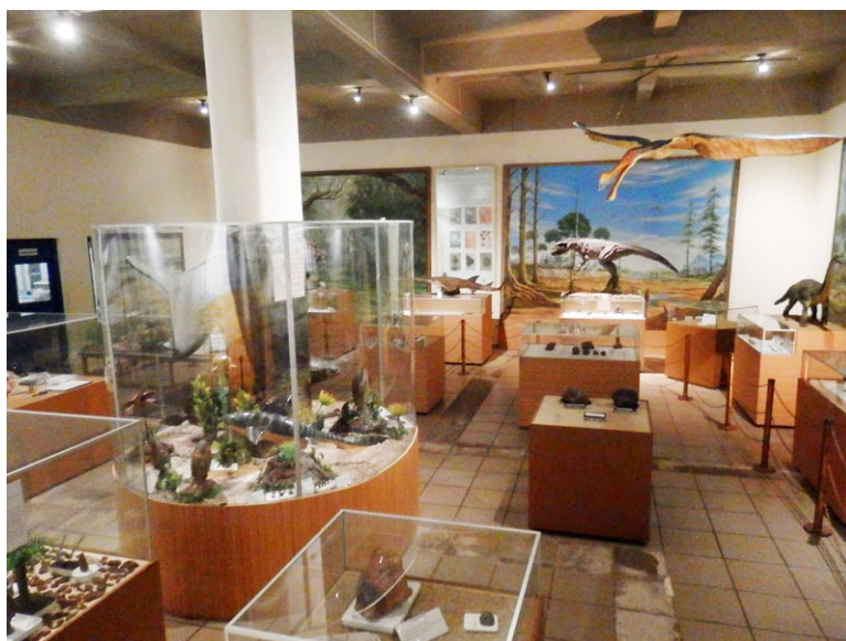
Figura 1. Exposição Paleontológica do CPHNAMA. Visão geral da exposição, onde é possível observar seus elementos e sua organização. A maioria encontra-se isolada por cordões ou redomas de vidro.

O setor de Paleontologia é composto basicamente por três áreas: a exposição permanente (Figura 1), que recebe o público visitante; o laboratório, onde a equipe realiza seus estudos e em que os fósseis coletados passam por limpeza, manutenção, triagem e preparação; e a Reserva Técnica, em que todo material referente às pesquisas é tombado e depositado.