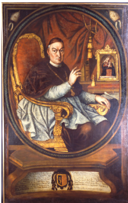
Fig. 1. Francisco Albán e hijo (firmado y fechado): Retrato del obispo Pedro Ponce Carrasco (1769, 167,5 x 106 cm, Museo de América, Madrid) y grabado de Giovanni Battista Sintès: Benedicto XIV (ca. 1740) que le sirvió como modelo

no fue un caso único en la obra de Albán, pues en otras de los años sesenta ya había consignado su nombre en dicho idioma. Es el caso del lienzo firmado perteneciente a la serie de los Ejercicios Espirituales , en el que firmó con la fórmula Fran.[cis]cus Alban pinxit . 29 Las dimensiones del retrato del obispo Pedro Ponce Carrasco (n.º de inventario el 00070) son 1,675 x 1,06 m (fig. 1). En