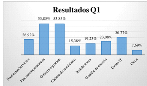
Figura 1. Gráfica de resultados de la pregunta de investigación Q1.