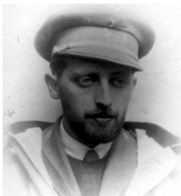
Lám. 11 Gonzalo Silvela Tordesillas. Entonces teniente de caballería en la reserva como enviado del general Saliquet tomó el control de Benavente el día 20 de julio deponiendo al gobierno municipal republicano. Mas tarde fallecería en 1937 con grado de comandante en una acción de guerra en el frente.