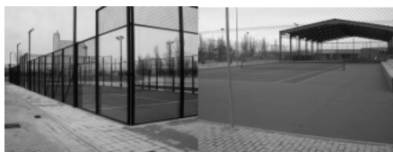
Lám. 9 La zona de los Salados, donde se preveía hacer el reparto de tierras en la actualidad, ocupada, hoy, por el estadio de Fútbol, piscinas de un club recreativo y complejos municipales deportivos de pistas de tenis y pádel.