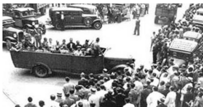
Lám. 10 Columna motorizada minera que acompañaba al convoy de ferrocarril a su salida de Oviedo en julio de 1936.