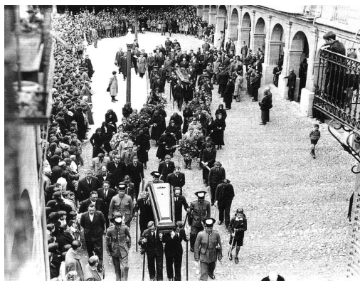
Lám. 6 Sepelio multitudinario de 6 de mayo de 1935 por las víctimas del accidente de la coral benaventana.