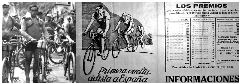
Lám. 5. Fotografía de ciclistas en los años 30 y cartel oficial de la primera vuelta ciclista a España en 1935.