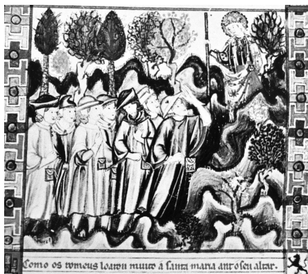
Lám. 2. Miniatura XLIX de las Cantigas de Santa María de Alfonso X el Sabio, que representa a la Virgen ayudando a los peregrinos, al igual que sucedió en el milagro de la Virgen carballeza. Biblioteca del Escorial.

Virgen y al Apóstol Santiago, y en la ribera opuesta divisan “una suave y desusada claridad, como de luna naciente”, y perciben a “Nuestra Señora, que amorosamente les invitaba con una señal a cruzar el río y a llegarse hasta Ella [...]. Y teniendo por Norte y Guía a la verdadera estrella del Cielo, cruzaron mansa y seguramente las bravas corrientes del río hasta tocar la opuesta ribera”. Aquí tenemos la temática, tan característica de las cantigas alfonsinas, de la Virgen como guía, tal como reza el refrán de la cantiga número 100, “ Santa María, estrella del día, muéstranos la vía para Dios, y guíanos ” 35 . Por tanto, el milagro de la Virgen de la Carballeda trata una temática totalmente medieval y que ya Alfonso X recoge de fuentes anteriores al siglo XIII.