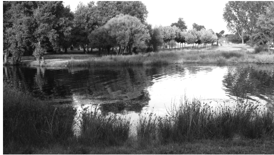
Lám. 1. El río Negro a su paso por Rionegro del Puente. Su crecido caudal, en medio de las peregrinaciones jacobeanas medievales, fue el causante del milagro que realizó la Virgen de la Carballeda.

Lo que diferencia a ambos relatos es que en el primero los romeros son los que extienden sus capas sobre el río, logrando cruzarlo sobre ellas. Sin embargo, en la segunda versión de la leyenda es la Virgen la que extiende su manto para que crucen los peregrinos el embravecido río Negro.