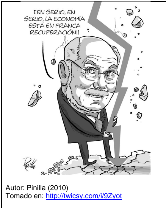
Gráfico 3: Caricaturas Venezolanas