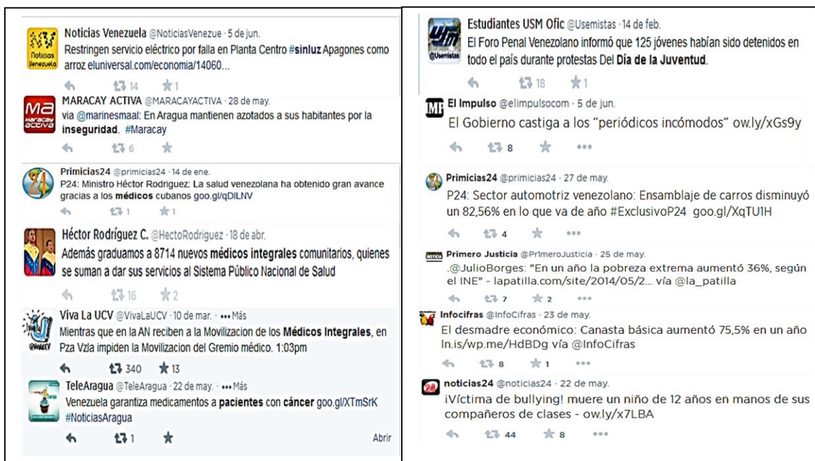
Gráfico 2: Panorama social. Una visión desde el Twitter.