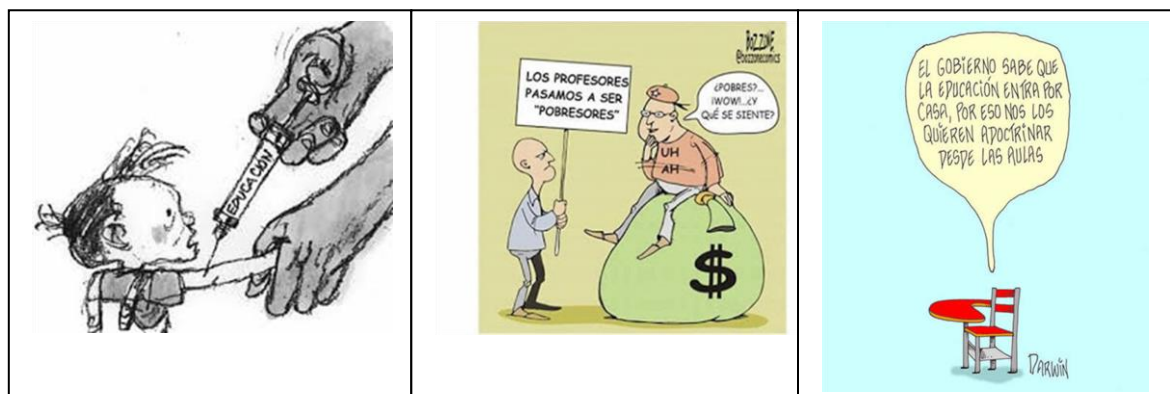
Gráfico 4: Caricaturas

Por otro lado, esta herramienta puede ser usada para realizar análisis al sistema educativo actual, en varias ocasiones se evidencia que estos caricaturistas venezolanos, utilizan sus espacios para dedicárselo a las diversas aristas que tiene el sistema educativo venezolano, no obstante, en la red se cuenta con gran variedad de éstas. A continuación, se pueden evidenciar algunas de ellas: