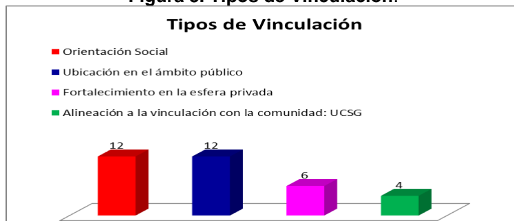
Figura 3. Tipos de Vinculación.

De los 34 Trabajos de Titulación, se destacan cuatro ámbitos que se detallan en el gráfico siguiente: