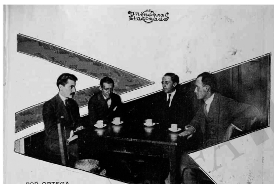
POR ORTEGA Foto publicada en el artículo de Febronio Ortega “Zig zags en la República de las Artes: Maples Arce arremete contra todo el mundo” en: El Universal Ilustrado (septiembre de 1923).

List Arzubide comentaba que Maples Arce se hizo amigo “de la clientela que estaba a punto de llegar al establecimiento, pero se deshacía en la entrada sin penetrar nunca” y “había dado propinas sonoras a una mesera incógnita” (List Arzubide, 1980:25). Esta descripción del Café de nadie , bastante difícil de entender, viene explicada de mejor manera por Arqueles