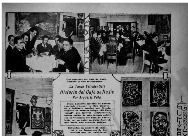
Artículo de Arqueles Vela, El Universal Ilustrado , 17 abril de 1924

Así, la tarde estridentista y el Café de nadie son dos elementos novedosos en el panorama cultural e intelectual de la Ciudad de México de los años 20 porque aunque los cafés en la Ciudad de México ya tenían décadas, los estridentistas los viven y los utilizaron de manera diferente. Como comenta Elissa J. Rashkin en La aventura estridentista , la idea del café como lugar de reunión y de difusión de ideas para artistas e intelectuales se encontraba en un estado embrionario en la capital mexicana de los años 20 (Rashkin, 2014). La tradición del café literario, en donde los intelectuales y los escritores se intercambiaban ideas, novedades y escritos, ya se acostumbraba en Europa desde el siglo XIX, y había evolucionado con el tiempo, así como evolucionaba la figura del intelectual.