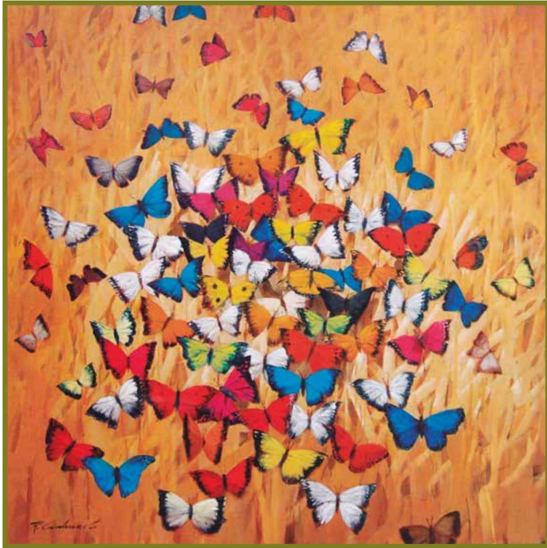
Raúl Cárdenas. Estío (de Estaciones) . 150 x 150 cm.