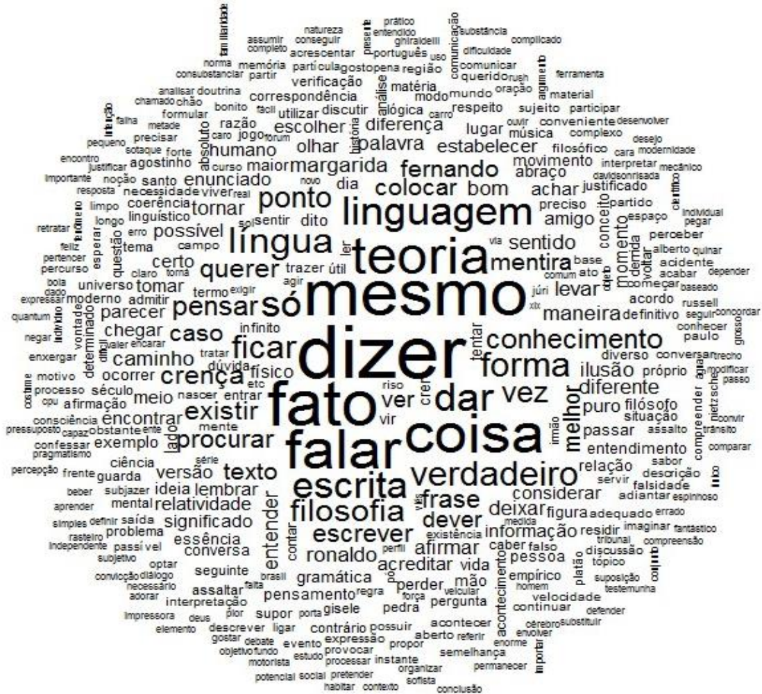
Figura 2: Nuvem de palavras do curso de Filosofia da Linguagem.