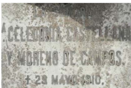
Figura 5: Detalle de la lápida.