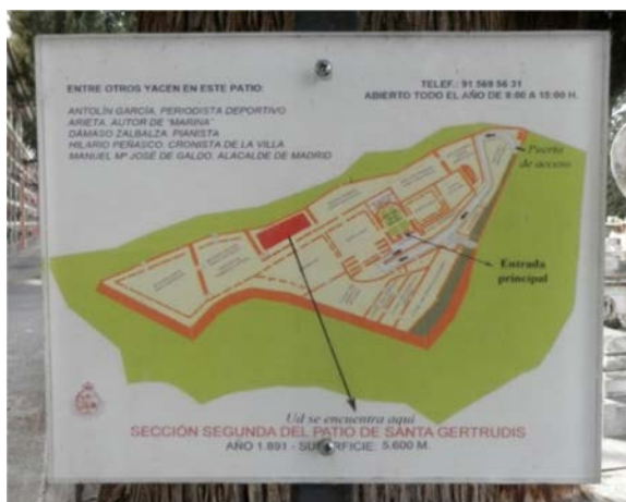
Figura 9: Señalización de la localización de las sepulturas y mención a Hilario Peñasco como cronista de la villa de Madrid.