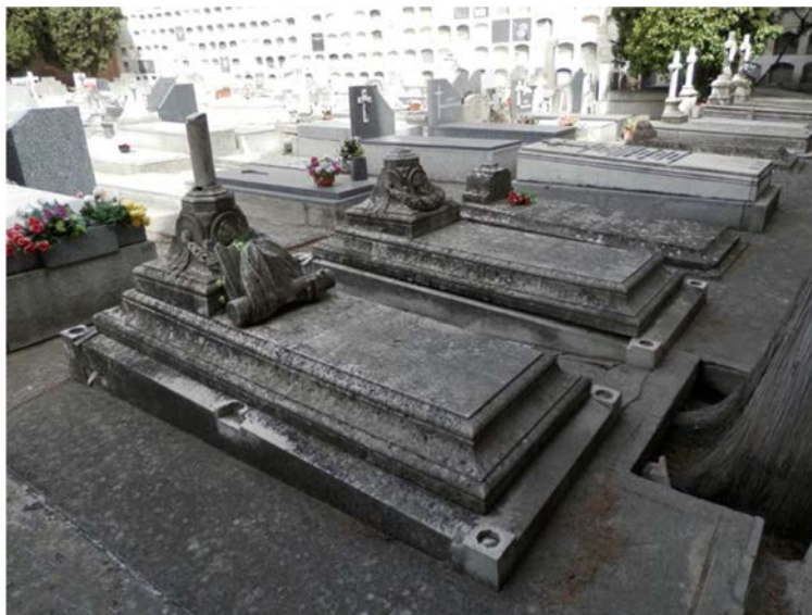
Figura 8: Sepulturas donde están enterrados algunos de los protagonistas de esta historia. Sacramental de San Justo (Madrid), Patio de Santa Gertrudis, 2ª sección.