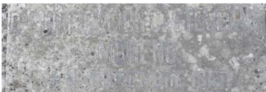
Figura 10: Detalle de la sepultura donde se encuentra enterrada Purificación Castellana Moreno. Sacramental de Santo Justo (Madrid), Sección 2ª del Patio de Santa Gertrudis, número 195.