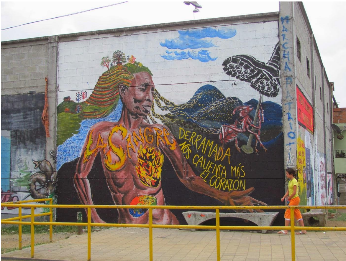
“La sangre derramada nos calienta más el corazón”. Mural realizado por el colectivo de Diseño la Colmena en Medellín, Colombia.

http://polinizaciones.blogspot.com/2014/03/polinizando-mesoamerica-resiste-en.html