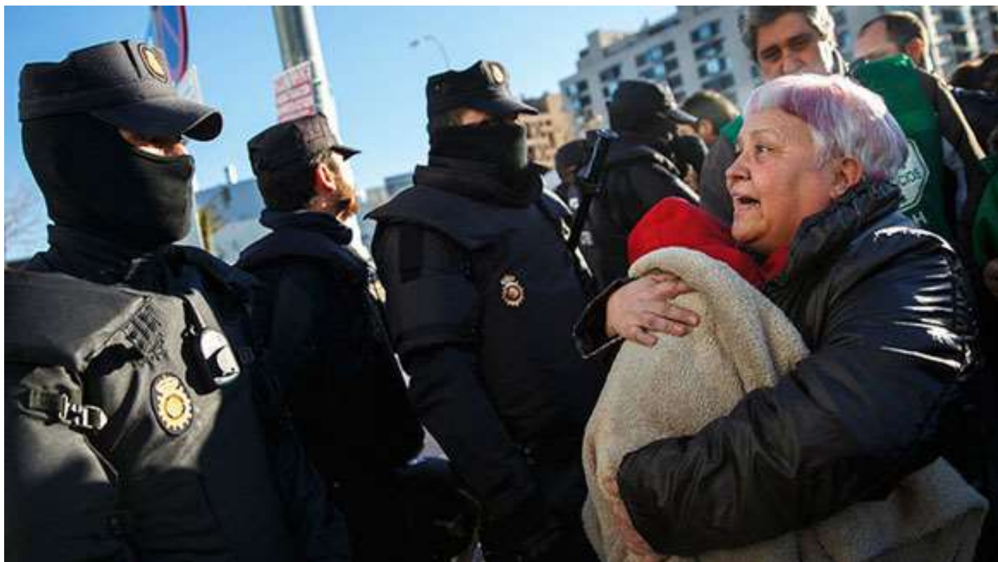
Mujer desahuciada con tres menores en España.