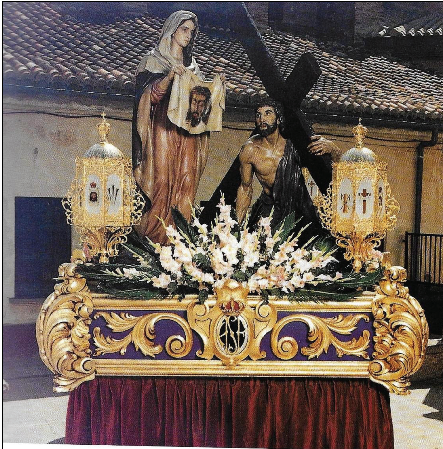
3. Mariano Benlliure. La Verónica , 1943. Paso procesional. Cofradía de la Santa Faz. Museo de la Semana Santa Marinera. Valencia.