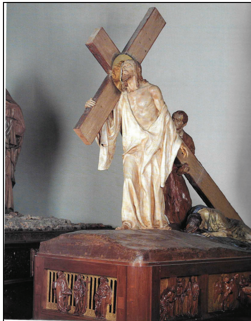
2. Mariano Benlliure. Redención , 1931. Paso procesional, Cofradía de Jesús Nazareno. Zamora.