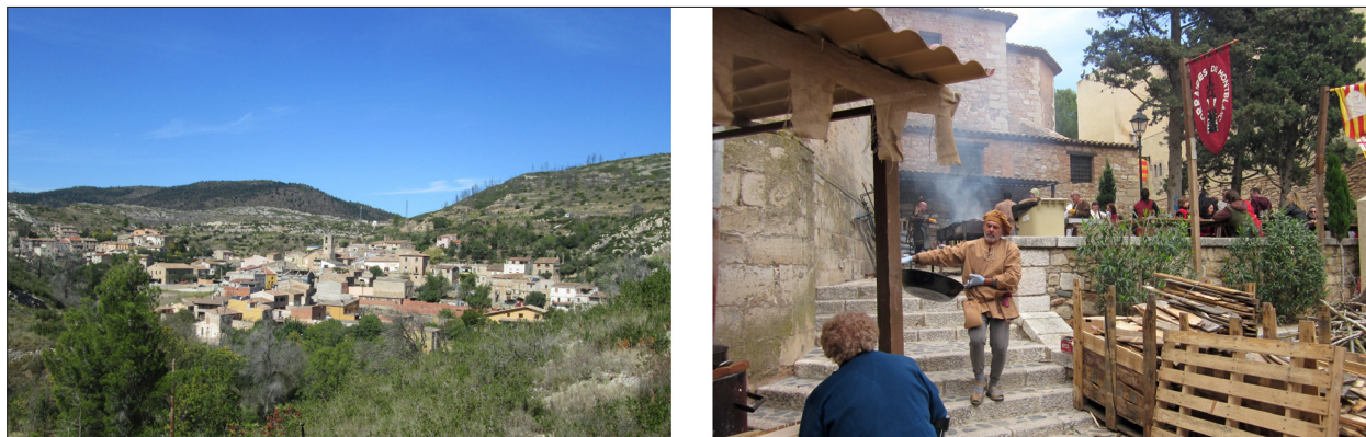
FIG. 2. Le village de Biure dans l'arrière-pays de la Costa Brava, Espagne, à gauche (photographie: André Suchet, septembre 2014) ; à droite, Montblanch et ses festivités médiévales dans l'arrière-pays de la Costa Dorada, Espagne. (photographie: André Suchet, mai 2014).

s'agissant d'un espace supposé agricole. Pour les approches ruralistes des années 1980, on pense au travail de Marié (1982) ou Catanzano (1987), puis Dérioz (1994) et Rouzier (1990), mais aussi à de très nombreuses études qui mobilisent seulement ponctuellement ce vocabulaire comme dénomination au cours de leur analyse.