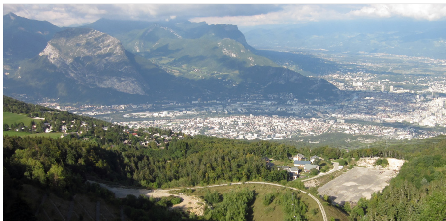
FIG. 3. La ville de Grenoble et son arrière-pays cité en définition du mot par le CNRTL, France. (photographie: André Suchet, juin 2015).