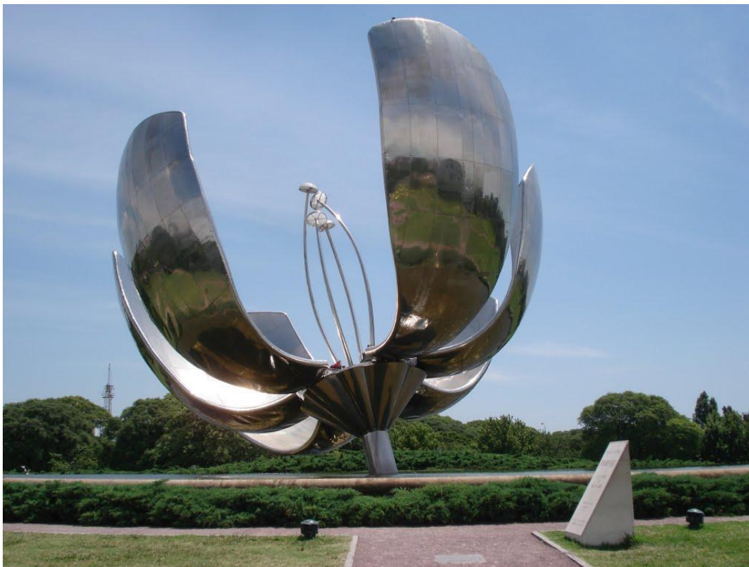
Floralis Genérica, escultura situada en Plaza de las Naciones Unidas. Buenos Aires, Argentina.

En esta ciudad de los lugares evasivos, no es estimulada por aquellos residentes que viven y trabajan allí. Hay una población más vasta y amplia en el ciudadano entendido como city user , donde los lugares cuentan según el uso que se le va dando –un uso parcial–, independiente del sentido de pertenencia (Amendola, 2010). Es ahí donde encontramos la principal diferencia entre los lugares según su sentido originario y este tipo de lugares, donde el arraigo, la cultura y la apropiación no acontece. Es un arraigo y una adhesión momentánea y sensitiva lo que producen, reforzada, claro está, por la inmediatez de las sensaciones adscritas a la potencialidad de consumo, cuan usuario de la ciudad.