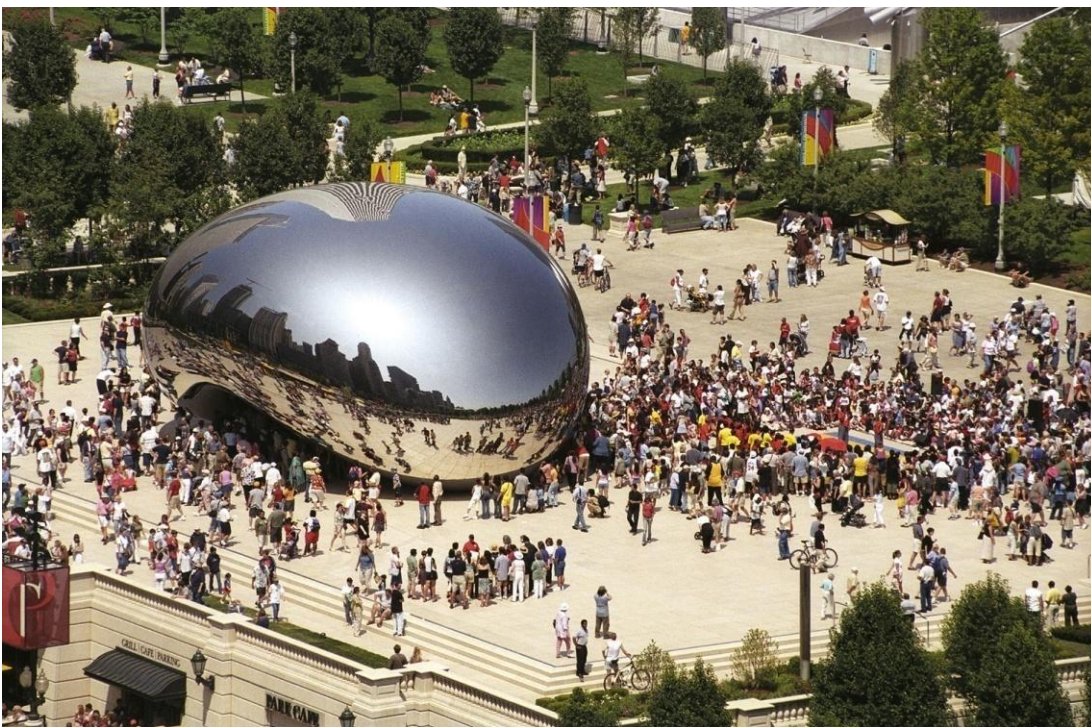
Cloud Gate, en el Millenium Park de la Ciudad de Chicago. (Fuente: Anish Kapoor, 2004, http://anishkapoor.com/110/cloud-gate-2 )

Los lugares retornan como forma de propiciar una vida sensorial, afectiva y emotiva en las ciudades. La racionalidad espacial, al ser concomitante con el ciclo de acumulación capitalista, tiene la fragilidad de no poder perpetuarse por mucho tiempo de un modo rígido y lineal. La manera de retrotraer el lugar a escena ha ubicado a los ciudadanos como usuarios de la ciudad (Amendola, 2008, 2009), quienes viven la experiencia de recorrer los espacios públicos y de consumo provocando un arraigo por aquellos sentidos que, junto a la vista y el tacto, los convierte en legítimos y atractivos, pero con la contracara de ser un arraigo que se desvanece, de ahí la idea de evanescente o evasivo. Algunos de estos lugares son excéntricos, donde se recrean lugares abstractos en espacios metropolitanos donde la identidad se halla diseminada.