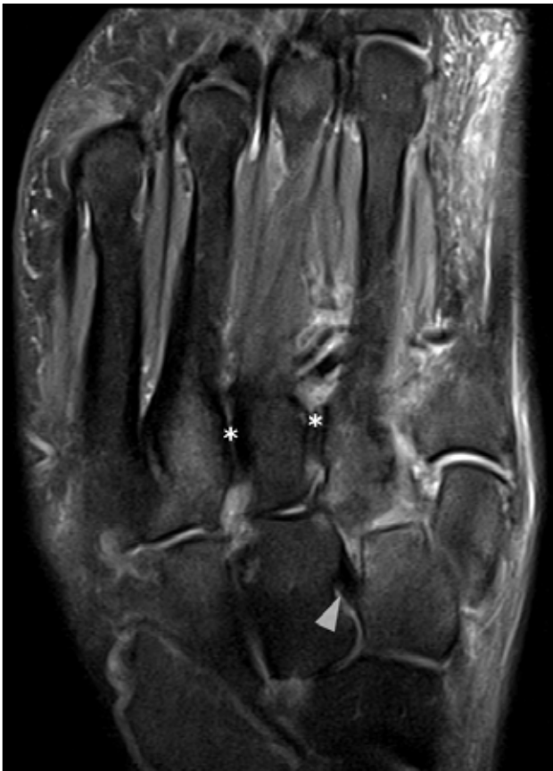
◀ Figura 4. Resonancia magnética, corte axial, secuencia de densidad protónica con supresión grasa. No se advierte el ligamento C1-M2 en su topografía esperable. Compárese la señal con los ligamentos interóseo C2-C3 (punta de flecha) y M2-M3 y M3-M4 (asteriscos).