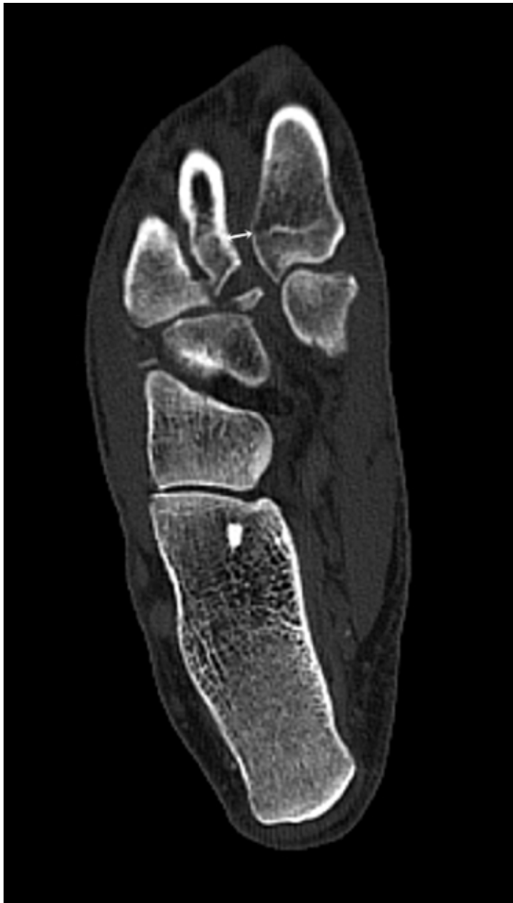
▲ Figura 8. Tomografía computarizada, plano axial. La flecha indica la separación entre los metatarsianos primero y segundo.