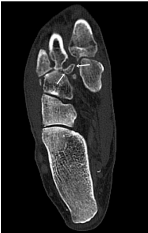
▲ Figura 6. Tomografía computarizada, plano axial. Se delimita el fragmento óseo originado en la base del segundo metatarsiano.