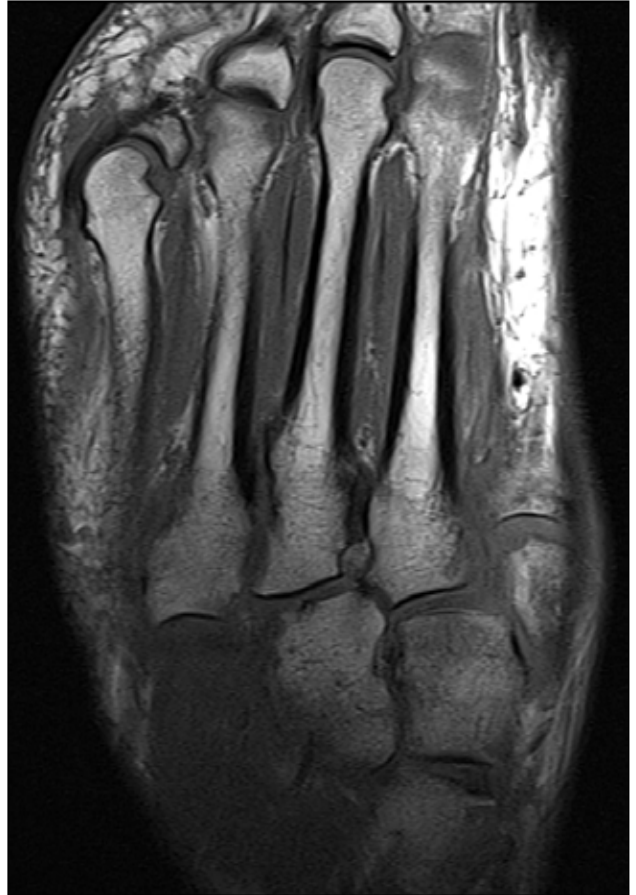
Figura 3. Resonancia magnética, corte axial en secuencia T1. Se advierte leve desplazamiento lateral de la base de los metatarsianos segundo, tercero y cuarto.