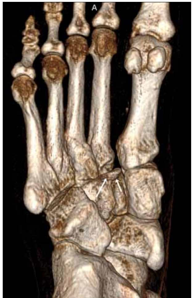
▲ Figura 7. Tomografía computarizada tridimensional. El mismo hallazgo de las Figuras 2 y 6 representado en reformateo 3D (flechas).