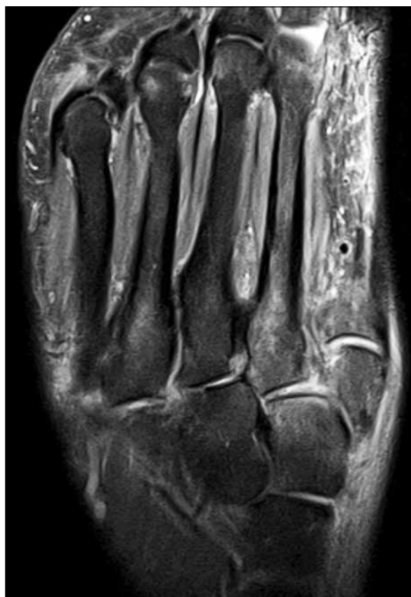
Figura 1. Resonancia magnética, corte axial, secuencia de densidad protónica con supresión de grasa. Se observa edema en la médula ósea de las cuñas medial y media, así como en la base de los metatarsianos, principalmente en el primero, segundo y cuarto.