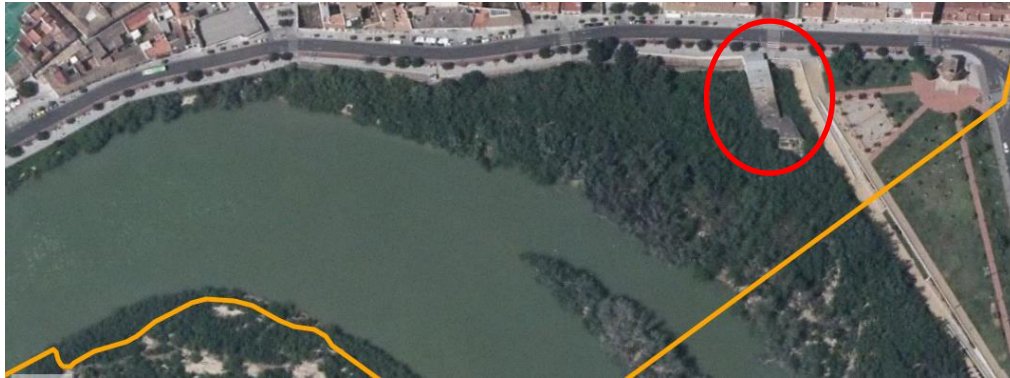
Ilustración 4: Vista sobre plano del Molino de Martos