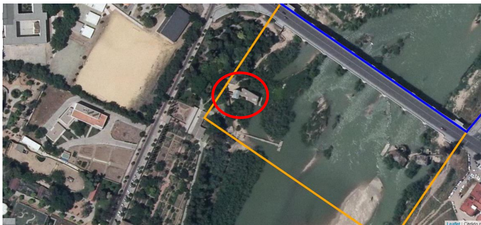
Ilustración 6: Vista sobre plano del Molino de la Alegría y Real Jardín Botánico