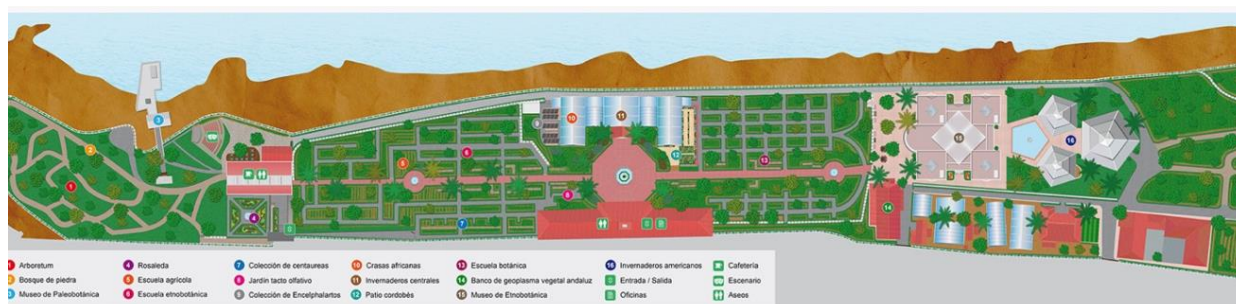
Ilustración 2: Plano del Real Jardín Botánico de Córdoba

En la siguiente ilustración podemos ver la distribución sobre plano de estos elementos.