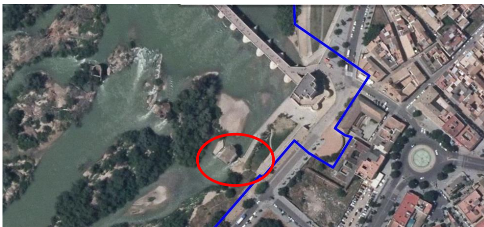
Ilustración 5: Vista sobre plano del Molino de San Antonio