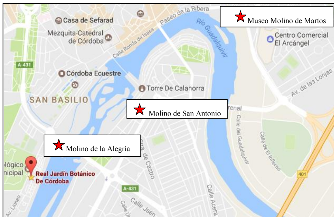
Ilustración 3: Ubicación sobre plano del Real Jardín botánico y molinos