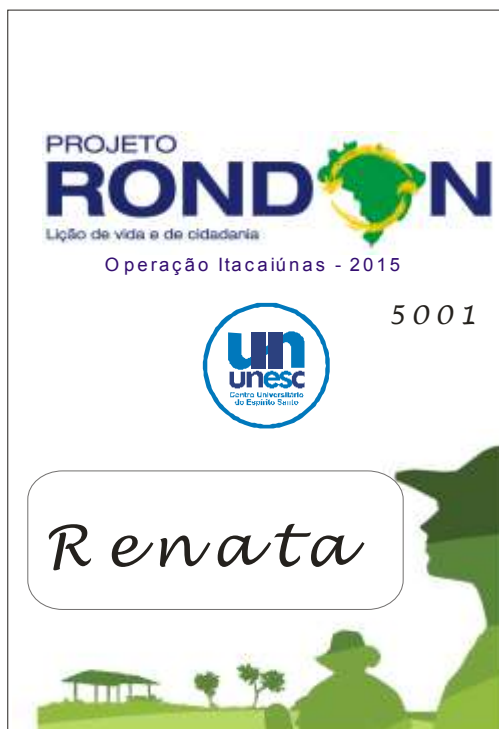
Figura 3 – Modelo do crachá do evento.

A Figura 3 apresenta o modelo do crachá com o nome do participante e a matrícula.