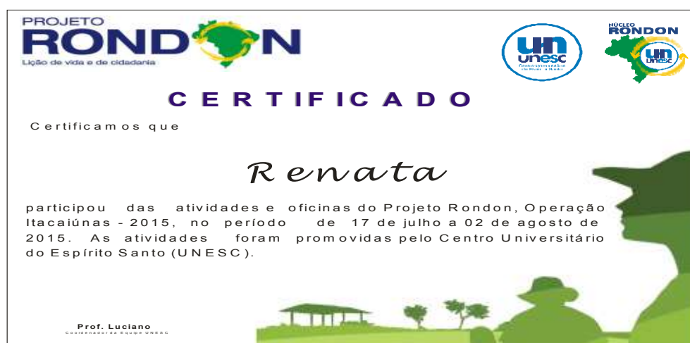
Figura 6 – Modelo do certificado impresso. Fonte: Elaborado pelos autores, 2015.

Após os cadastros durante todo o período em que os eventos da Operação Rondon foram realizados no município alvo, os certificados dos participantes são impressos em frente e verso para a entrega na cerimônia de encerramento das atividades ou para posterior entrega aos participantes que não estiveram presentes na mesma, sendo que os certificados restantes são entregues à Prefeitura do município para que realize esse encargo. A Figura 6 apresenta um exemplo de certificado impresso, sendo mostrada a frente do mesmo.