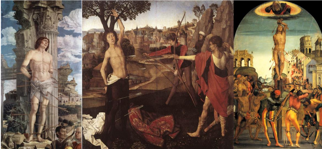
Figura 2 – Martírio de S. Sebastião , Andrea Mantegna, 1480. Paris, Museu do Louvre.

Martírio de S. Sebastião , Hans Memling, c. 1475. Bruxelas, Musées Royaux des Beaux-Arts.