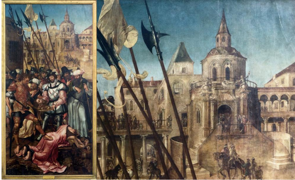
Figura 7 – Degolação de S. João Baptista, Gregório Lopes, 1536-1538 e pormenor das arquiteturas representadas no plano de fundo. Tomar, Igreja de S. João Baptista.

Lisboa, e a parte superior da fachada da igreja da Graça, erguida por Nicolau Chanterene apenas um ano antes, em Évora, cidade onde a corte permaneceria no decorrer de quase toda essa década.