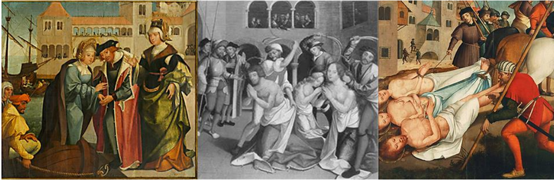
Figura 8 – Santos Mártires Veríssimo, Máxima e Júlia - Desembarque em Lisboa, Flagelação e Arrastamento pelas ruas, oficina lisboeta, c. 1530-1540.