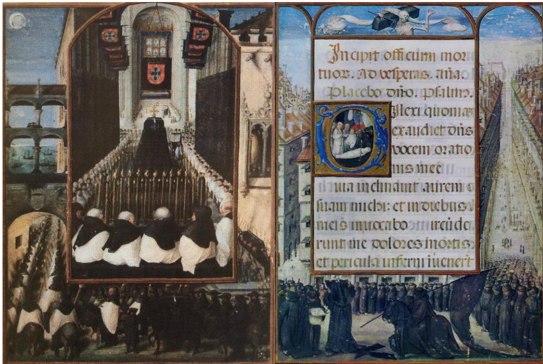
Figura 11 – Livro de Horas dito de D. Manuel (Ofício dos Mortos) , atribuído a António de Holanda, 1517 - 1551. Lisboa, Museu Nacional de Arte Antiga N.º de Inv. 14/129v. e 130.

Na iluminura do fólio 129, o cortejo fúnebre de D. Manuel abandona o Paço da Ribeira pelas escadas que no ângulo davam acesso à sala grande e, desenhando uma curva de 180 graus, passa debaixo do Arco dos Paços, situado no extremo norte da extensa varanda (Figura 12) 38 . Daí, a procissão noturna seguiria em direção ao Mosteiro dos Jerónimos onde, de acordo com a vontade expressa do monarca, o seu corpo seria sepultado. Também no fólio 130, onde surge representado o ritual da Quebra dos Escudos , procissão diurna realizada quatro dias após a morte do monarca, se torna claro que o pintor utilizou um cenário autêntico: o das ruas da Baixa lisboeta no tempo de D. João III. Socorrendo-se de um arrojado jogo perspético, o iluminador acentua a monumentalidade desta parte da cidade, até há muito pouco consensualmente identificada com a Rua Nova dos Mercadores. A rua paralela a esta, por seu lado, era sistematicamente remetida para o anonimato, não parecendo relevante na composição geral.