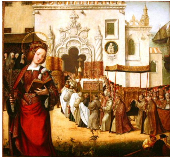
Figura 9 – Painel do Retábulo de Santa Aua. Chegada das relíquias ao Mosteiro da Madre de Deus (c.1518-1520). Lisboa, Museu Nacional de Arte Antiga, Inv. 1492 Pint.

Mais sugestivo, por constituir justamente um estratagema idêntico ao que Gregório Lopes adopta, se bem que pela forma inversa, é a representação do Paço da Ribeira no fólio 25 do Livro de Horas dito de D. Manuel (Figura 10) 33 , de António de Holanda, certamente ajudado por outros pintores, porventura até o próprio Gregório Lopes, como foi já aventado 34 . A figuração de toda a estrutura monumental do Paço, desde o torreão ao corpo norte onde se concentrava o grosso dos aposentos da corte, passando pela