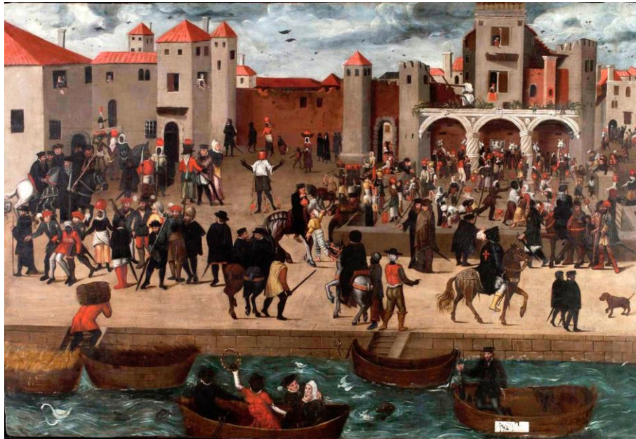
Figura 4 – Chafariz d'el Rey em Lisboa . Autor anónimo, c. 1570-80. Coleção Berardo.

caracterizar Lisboa como "um jogo de xadrez, tantos os brancos quanto os negros" 20 —, as chamadas "negras de canastra" que, transportando os despejos domésticos à cabeça, espantavam os visitantes, ou a forma como os portugueses de bem trajavam, com longas capas negras que lhes deixavam apenas os braços de fora, como relata Jan Taccoen 21 em 1514, são uma nota dominante nesta, como noutras representações 22 das zonas centrais e ribeirinhas da cidade de Lisboa (Figura 4).