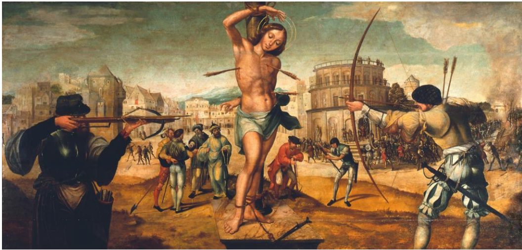
Figura 1 – Martírio de S. Sebastião , Gregório Lopes, 1536-1539.

Desta tábua (Figura 1), já exaustivamente estudada no âmbito do universo pictórico por diversos autores 4 , interessa-me focar um aspeto particular do discurso formal: a arquitetura que, em plano de fundo, encerra o campo figurativo e serve de cenário ao martírio do Santo.