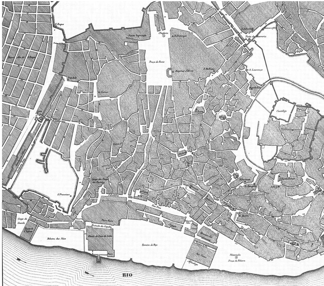
Figura 13 – Planta de Lisboa (pormenor). João Nunes Tinouco, 1650.

aquele que constitui indiscutivelmente um elemento identitário da Rua Nova dos Mercadores?