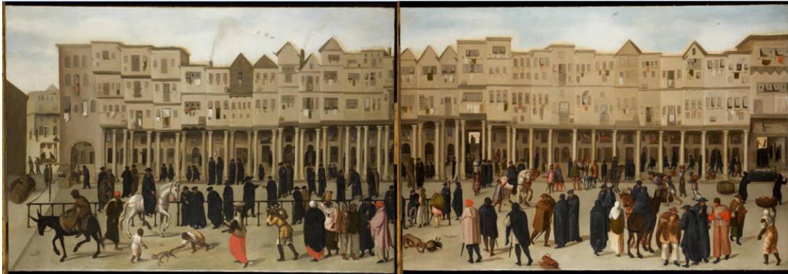
Figura 3 – Rua Nova dos Mercadores , em Lisboa. Autor anónimo, c. 1570-1590.