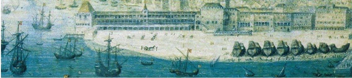
Figura 10 – Paço da Ribeira, em Lisboa. Livro de Horas dito de D. Manuel , atribuído a António de Holanda, 1517 - 1551. Lisboa, Museu Nacional de Arte Antiga N.º de Inv. 14/fl. 25v.

longa varanda, obrigou a um rebatimento horizontal, ou planificação das frentes construídas em ângulo recto 35 . No martírio, ao contrário, um só plano surge dobrado duas vezes, assim configurando as três frentes do terreiro em U.